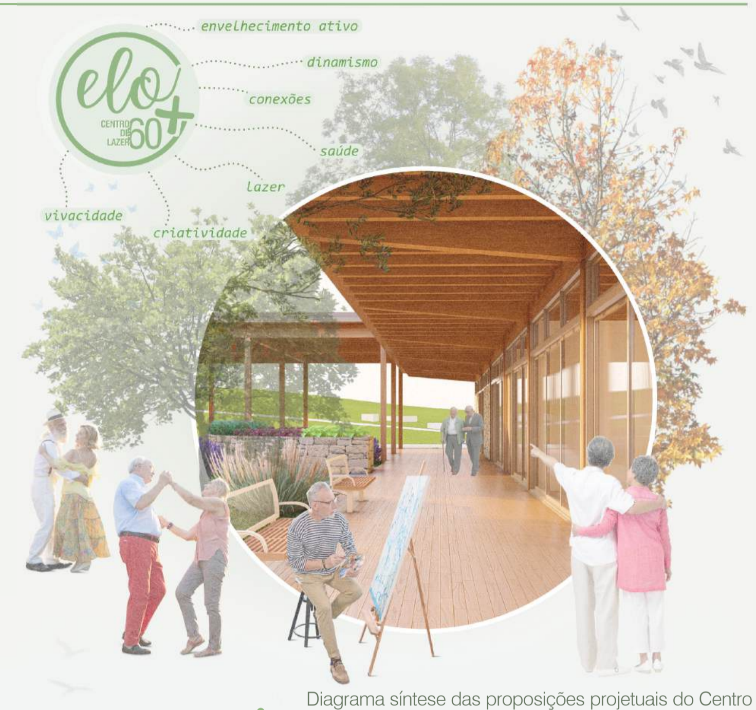
Diagrama síntese das proposições projetuais do Centro

O CENTRO | O projeto do Elo - Centro de Lazer 60+ objetiva proporcionar um local de desenvolvimento social, que por meio de suas atividades propostas, fomente a qualidade de vida da população da terceira idade, através da promoção de saúde de maneira preventiva, contando com espaços destinados às mais diversas atividades de lazer para a população 60+, proporcionando dessa maneira, saúde física, mental e social ao usuário.