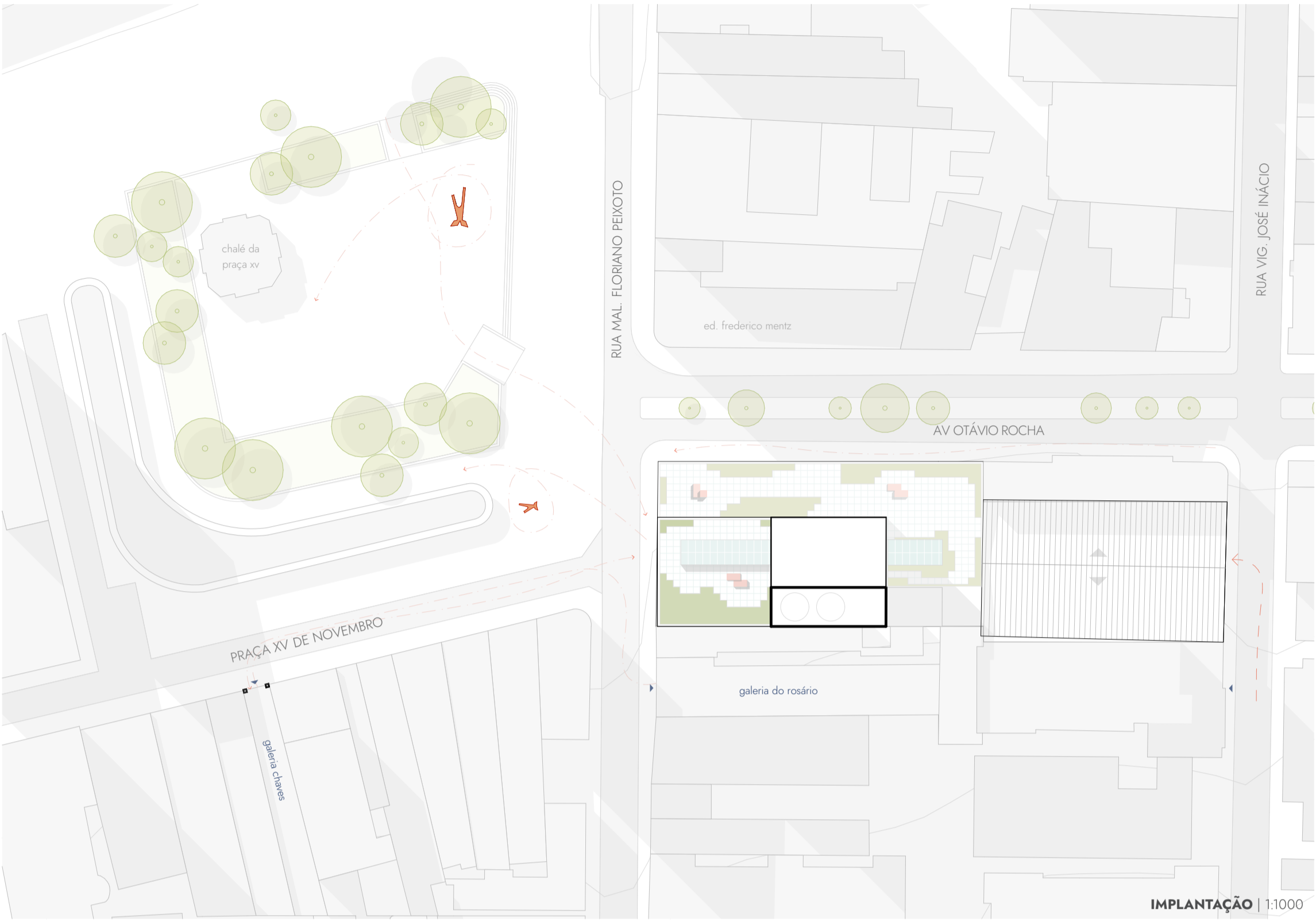
IMPLANTAÇÃO | 1:1000