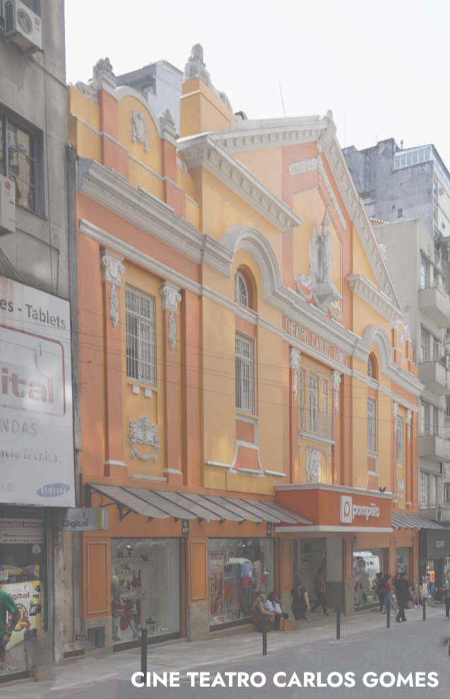
CINE TEATRO CARLOS GOMES