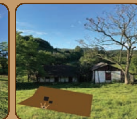
Figura 04: Lote do projeto.