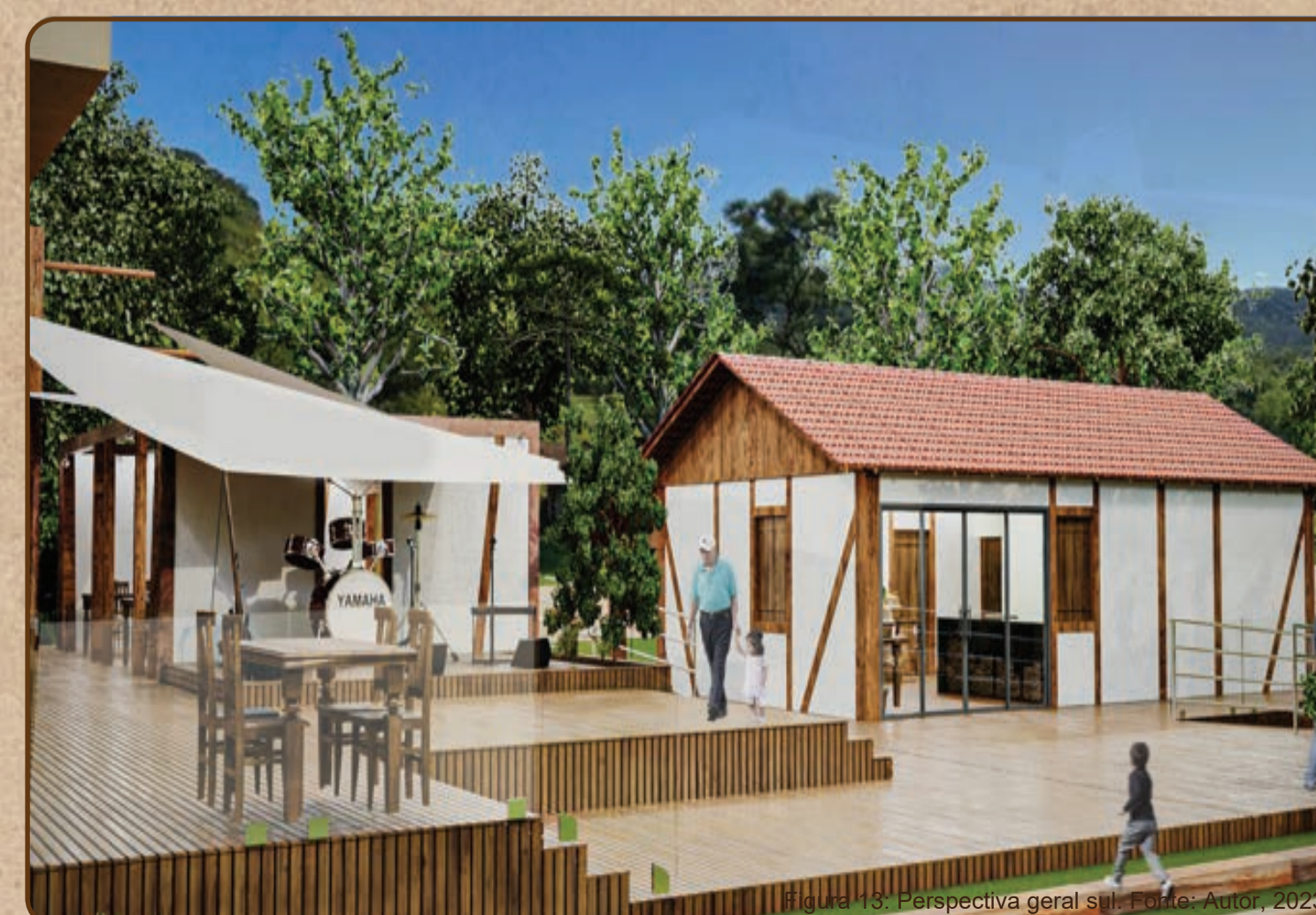
Figura 13: Perspectiva geral sul.