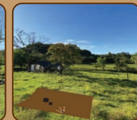
Figura 05: Lote do projeto.