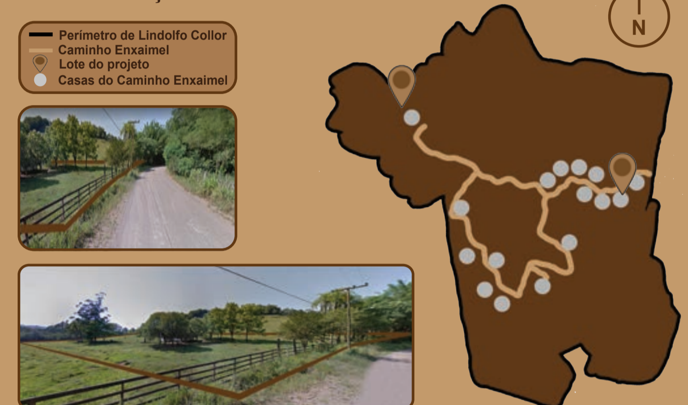
— Perímetro de Lindolfo Collor — Caminho Enxaimel ● Lote do projeto ● Casas do Caminho Enxaimel