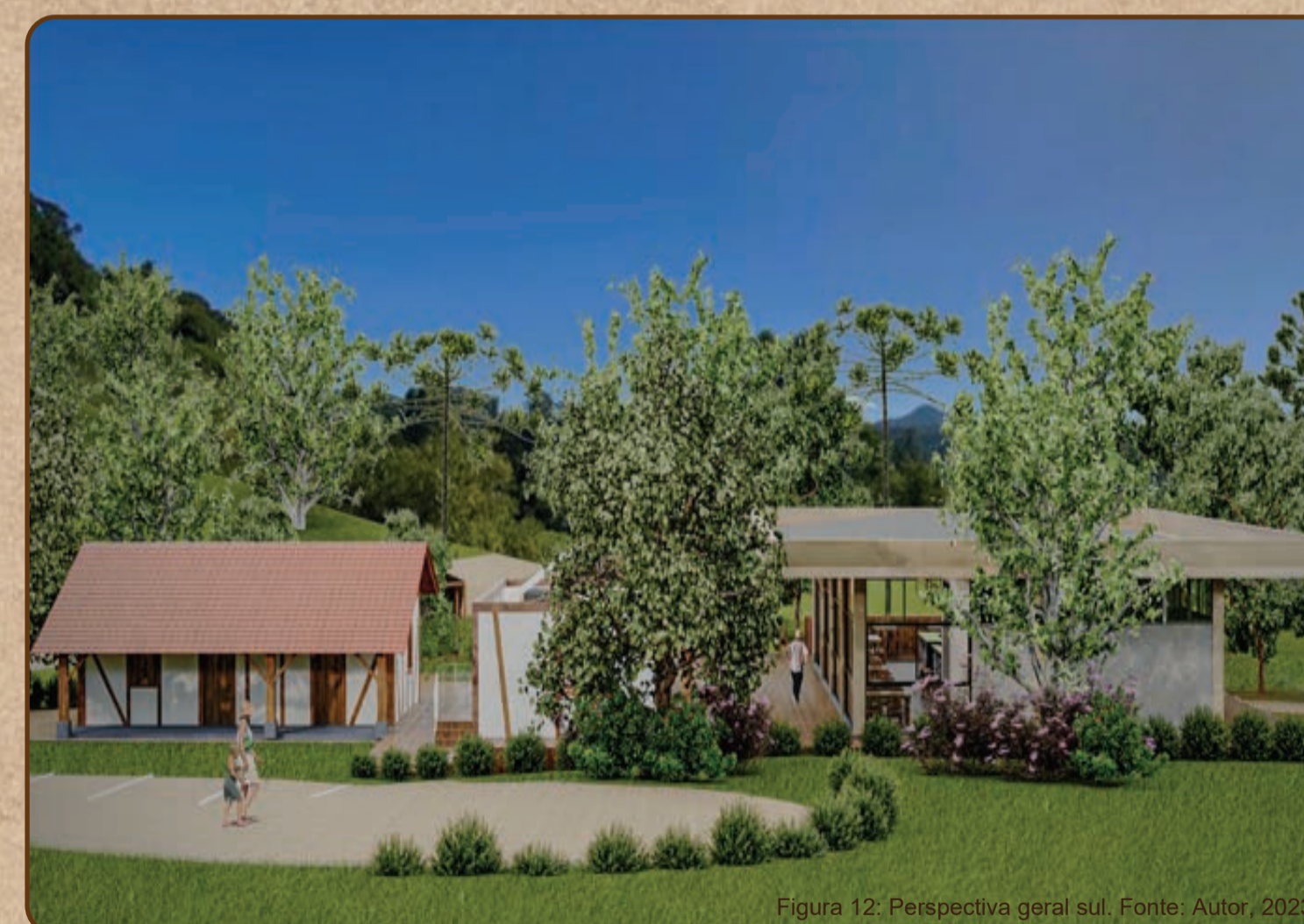
Figura 12: Perspectiva geral sul.