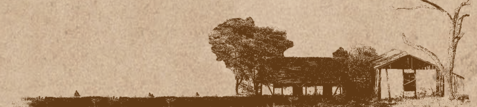
Figura 01: Lote do projeto. Fonte: Autor, 2022.

Uma nova edificação que abrigará um restaurante terá o importante papel de tornar viável o espaço gastronômico sem intervir na paisagem cultural local . Tal proposta será cumprida pela forma arquitetônica disposta e seus respectivos materiais , evidenciando a contemporaneidade sem agredir o entorno . Com o novo uso destinado a comercialização de produtos locais , uma edificação existente terá suas patologias tratadas sem a descaracterização da obra, valorizando o espaço e oferecendo uma estrutura adequada para tal, enquanto a segunda edificação existente será destinada a uma área de lazer ao céu aberto .