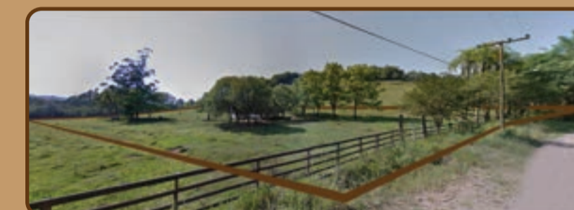
Figura 06 e 07: Lote do projeto.