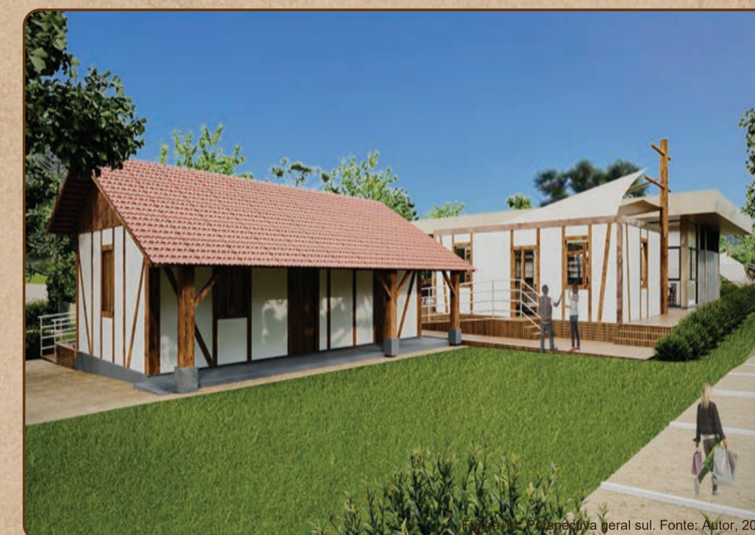
Perspectiva geral sul.