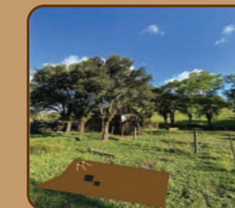
Figura 03: Lote do projeto.

A escolha desta localização se deu com a premissa de fomentar o turismo e a agricultura familiar na região. O sítio está inserido no Caminho Enxaimel de Lindolfo Collor (figura 08) e nas proximidades de outras rotas, como a Rota Romântica, importante para a captação e fomentação do turismo no município. A cerca de 4 km do centro da cidade, o lote localiza-se a sudeste da Estrada Geral 48 Baixa, na zona Rural, com testada de 77 metros e área de 15.070 m 2 . Este sítio e suas edificações existentes (figuras 03, 04 e 05) é um dos únicos no município com capacidade de expansão sem agressão da paisagem do entorno, além de estar situado no início do Caminho Enxaimel da cidade. O conjunto de paisagens como campos, vegetações, vias, construções, animais e folclores constituem uma paisagem irreproduzível e representa a vida e o cotidiano dos teuto-brasileiros que aqui vivem desde o século XIX.