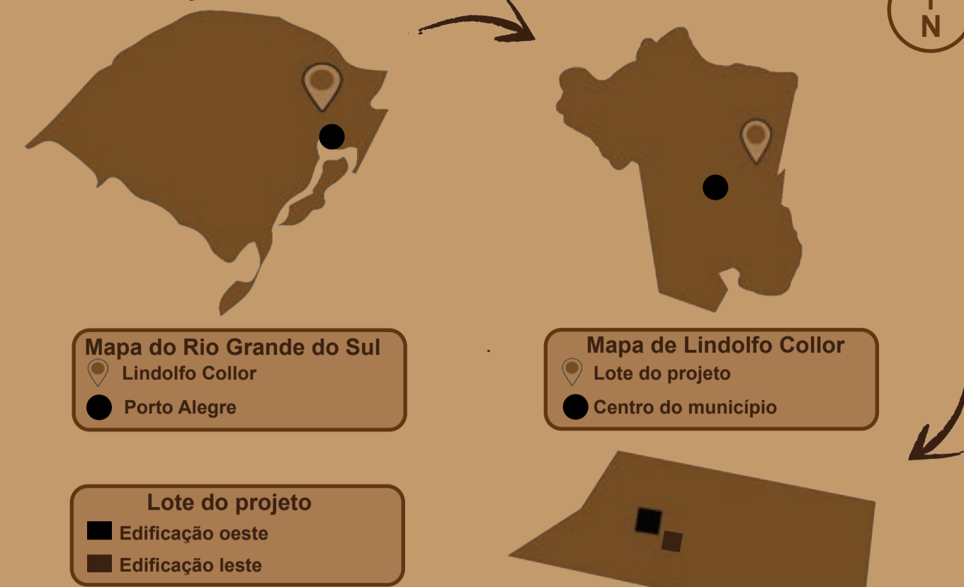
Mapa do Rio Grande do Sul Lindolfo Collor ● Porto Alegre