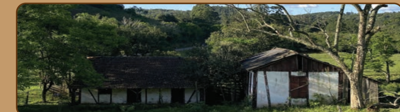
Figura 09, 10 e 11: Lote do projeto.