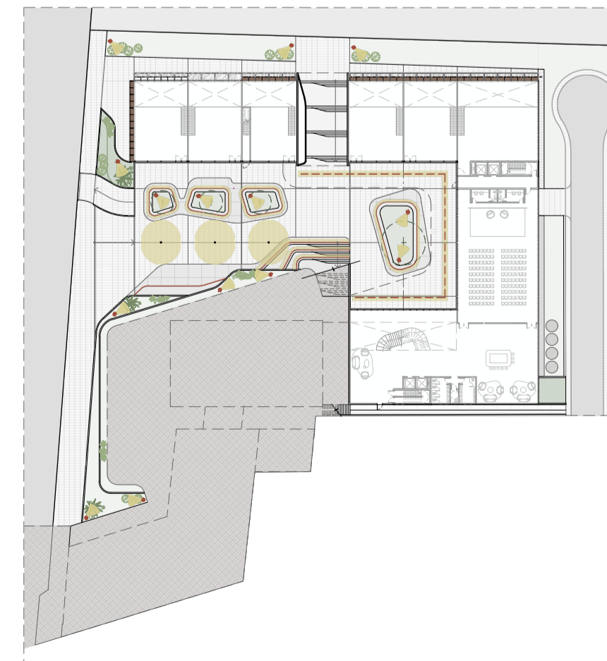
ILUMINAÇÃO ÁREAS ABERTAS Escala 1/750