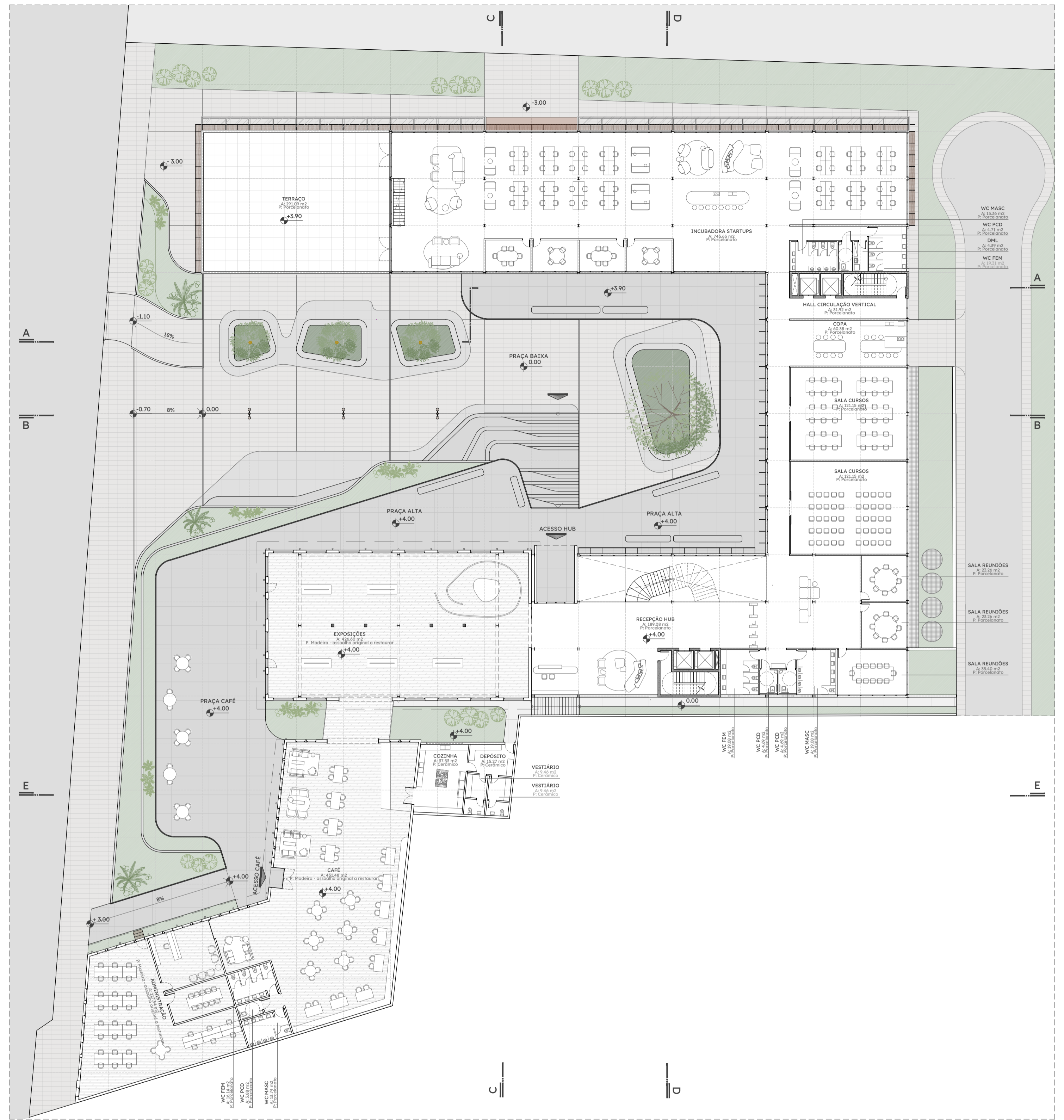
PLANTA BAIXA SEGUNDO PAVIMENTO Escala 1/200