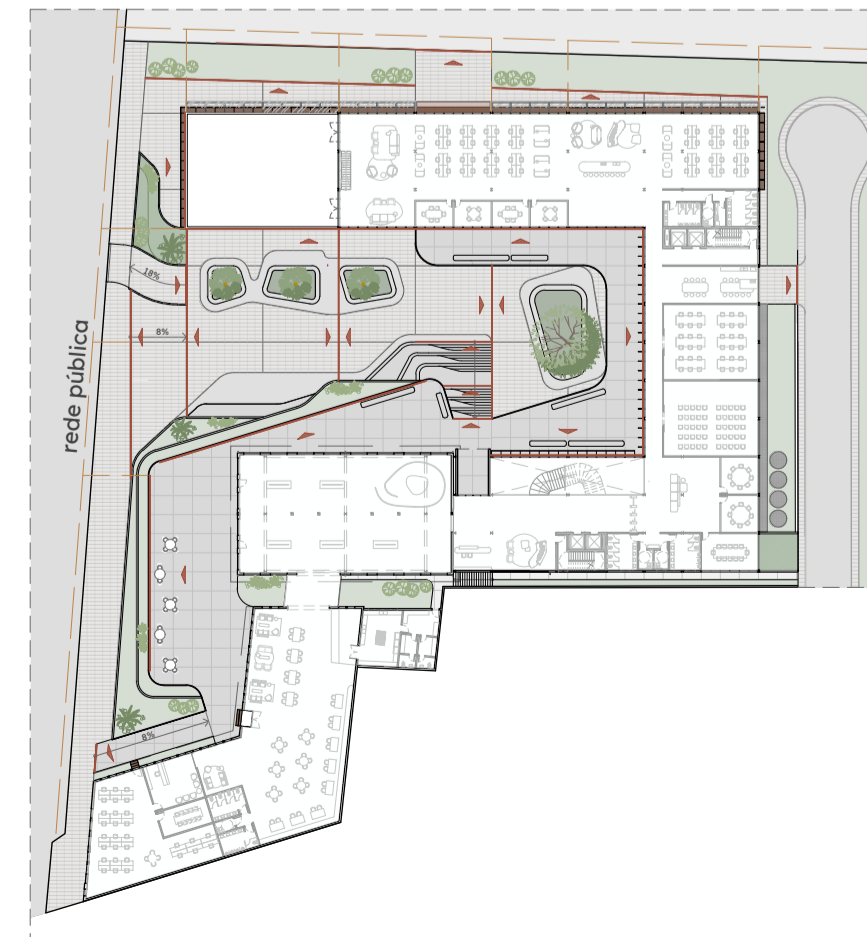
PISOS E DRENAGEM ÁREAS ABERTAS Escala 1/750