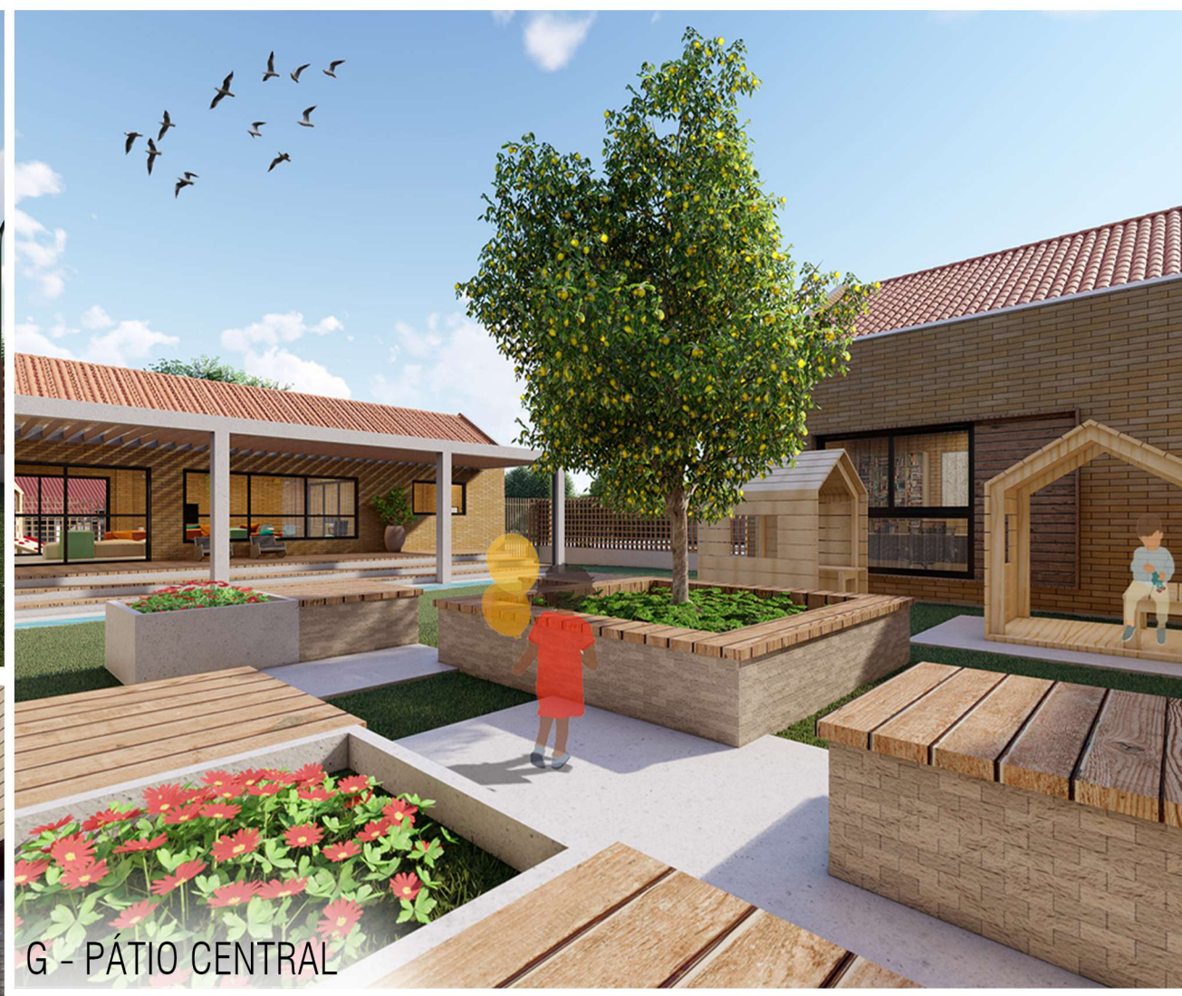
G - PÁTIO CENTRAL