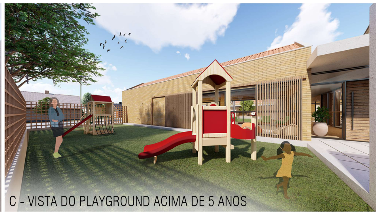
C - VISTA DO PLAYGROUND ACIMA DE 5 ANOS