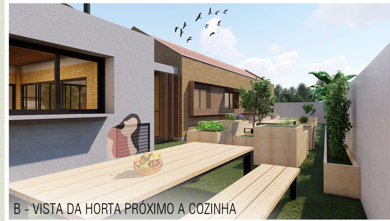
B - VISTA DA HORTA PRÓXIMO A COZINHA