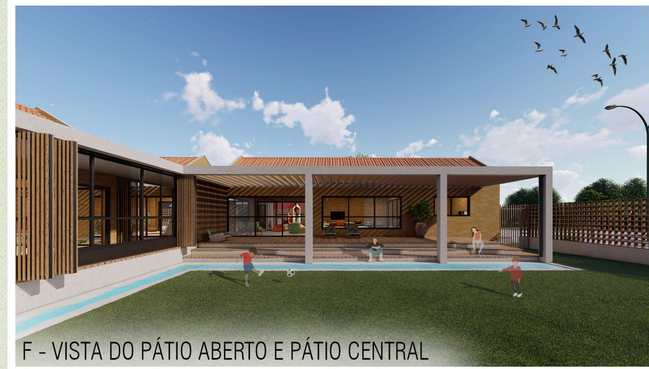
F - VISTA DO PÁTIO ABERTO E PÁTIO CENTRAL