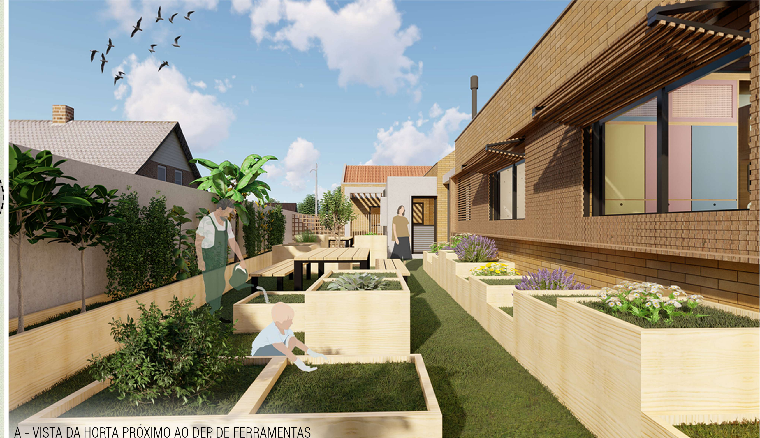
A - VISTA DA HORTA PRÓXIMO AO DEP. DE FERRAMENTAS