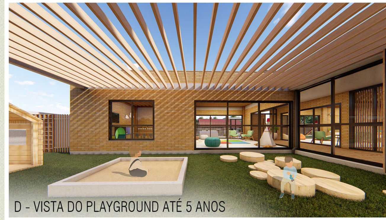
D - VISTA DO PLAYGROUND ATÉ 5 ANOS