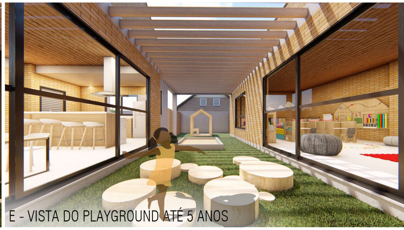
E - VISTA DO PLAYGROUND ATÉ 5 ANOS