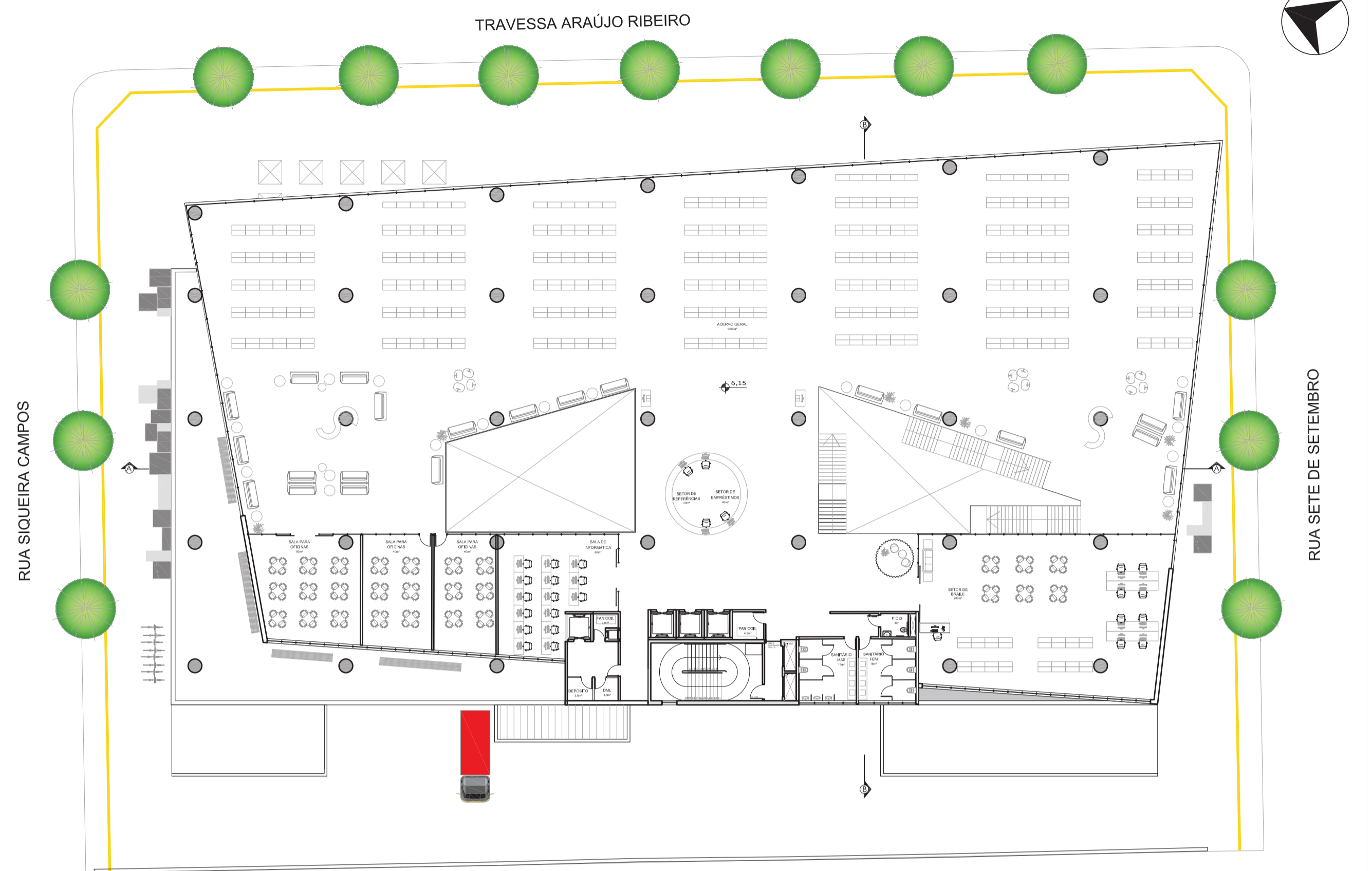
PLANTA BAIXA 3º PAVIMENTO Esc.: 1:400