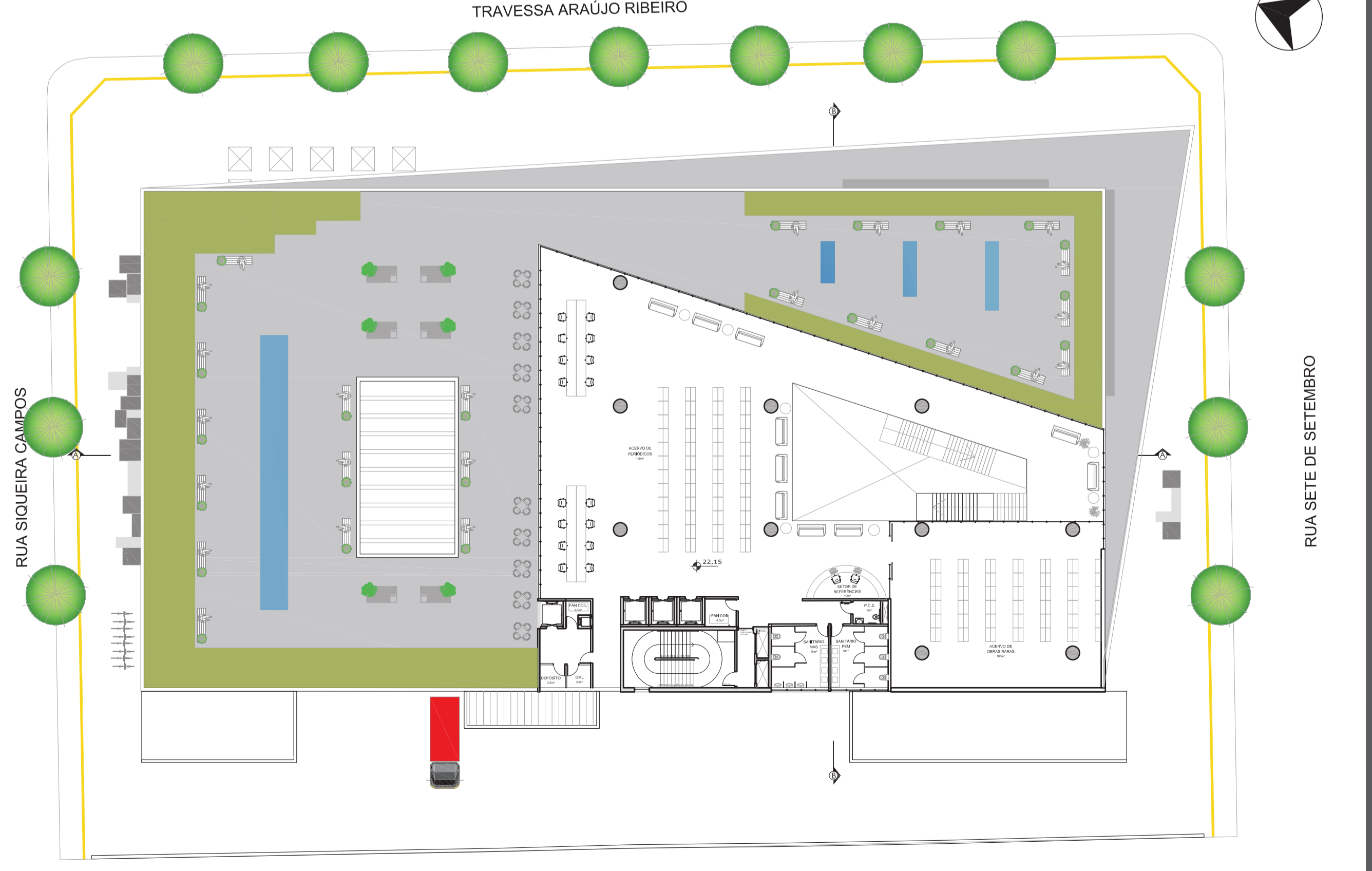
PLANTA BAIXA 6º PAVIMENTO Esc.: 1:400