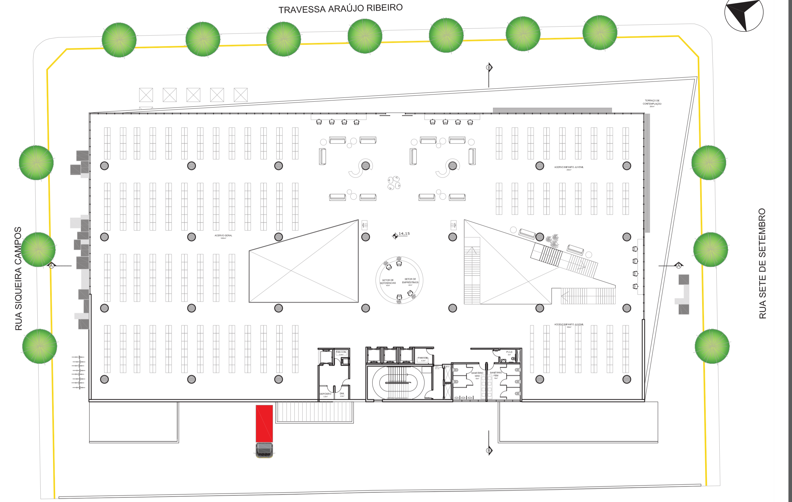
PLANTA BAIXA 4º PAVIMENTO Esc.: 1:400