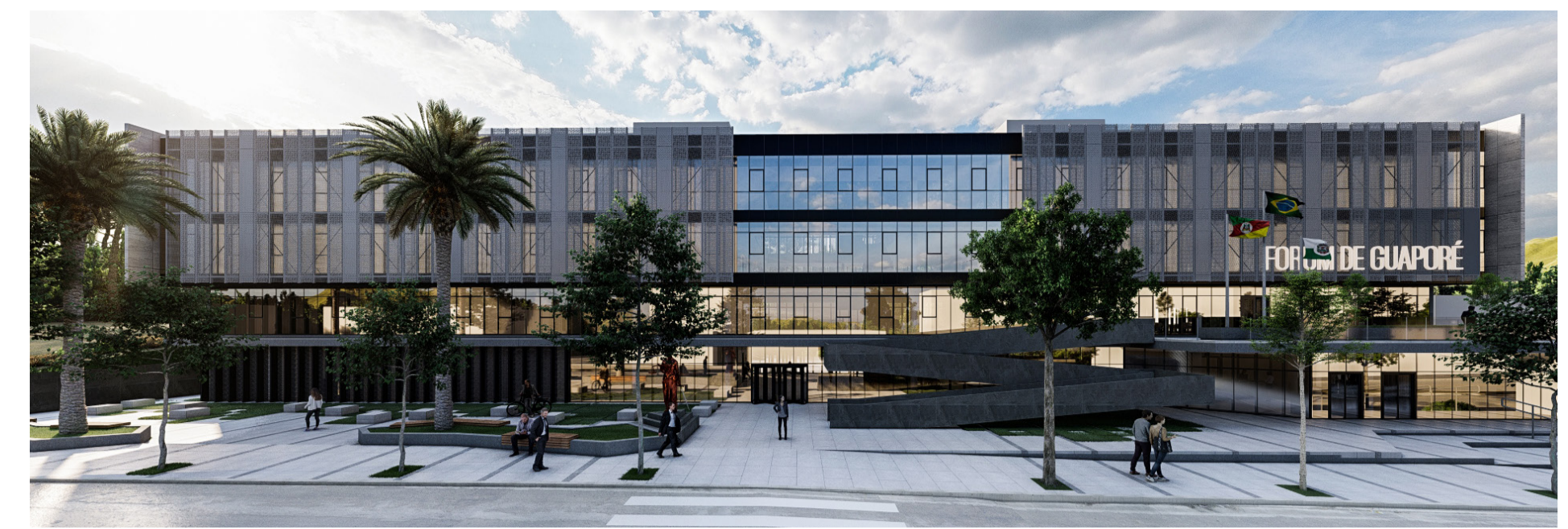
img. perspectiva fachada sul img. perspectiva fachada norte