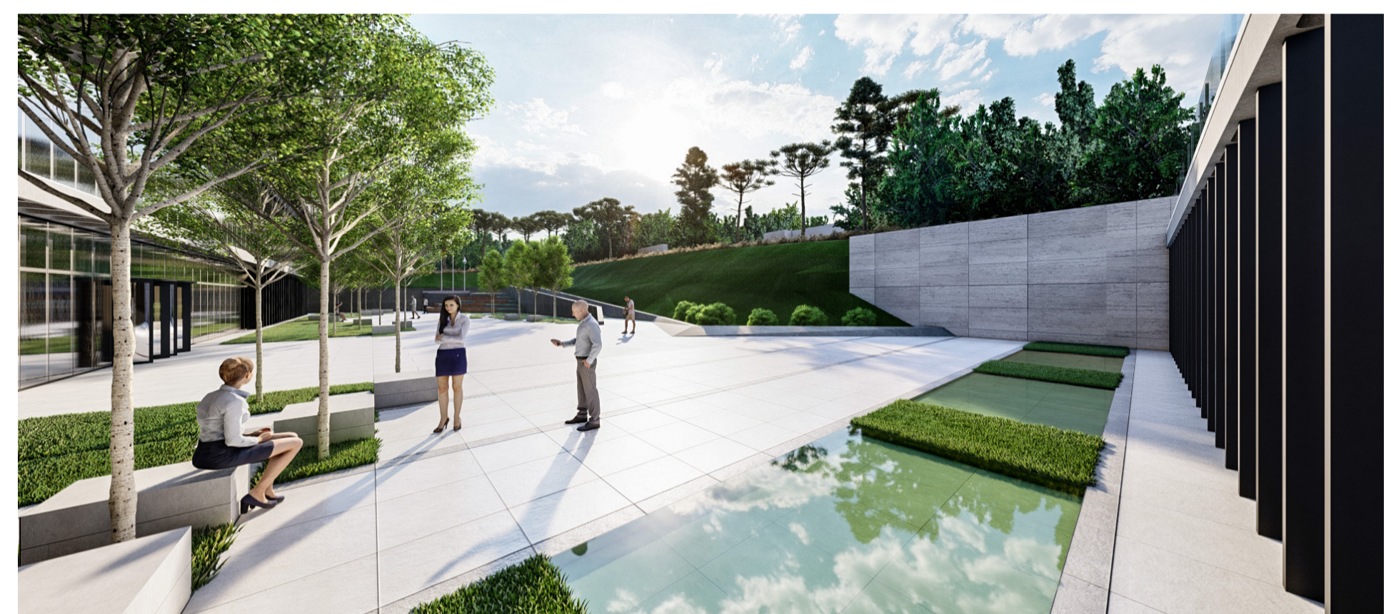
img. perspectiva praça cívica img. perspectiva praça cívica