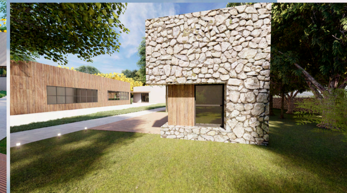
PERSPECTIVA CHALÉ PCD E AOS FUNDOS BLOCOS DE CONVIVÊNCIA HOTEL