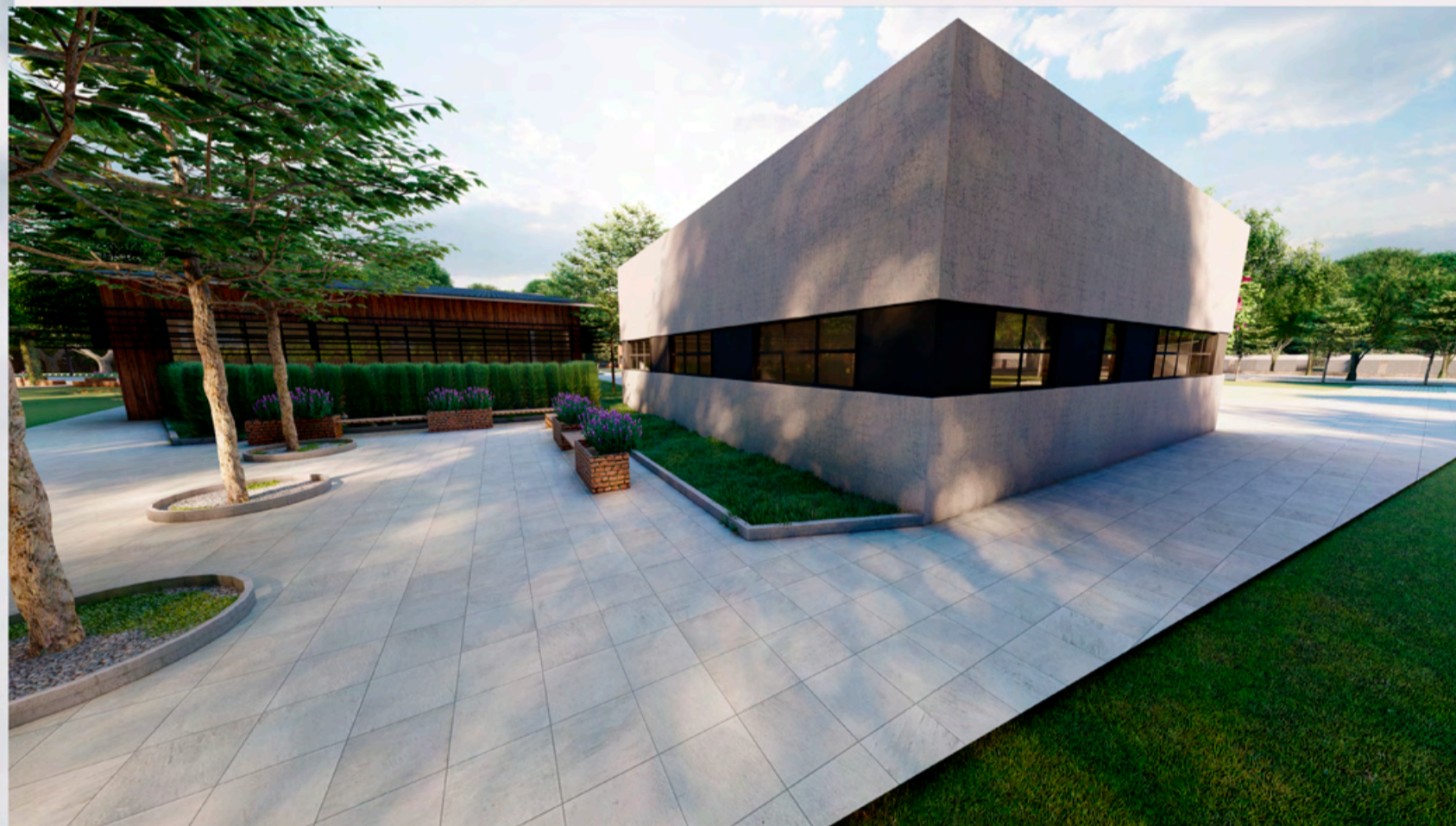
PERSPECTIVA BLOCO DE SERVIÇO