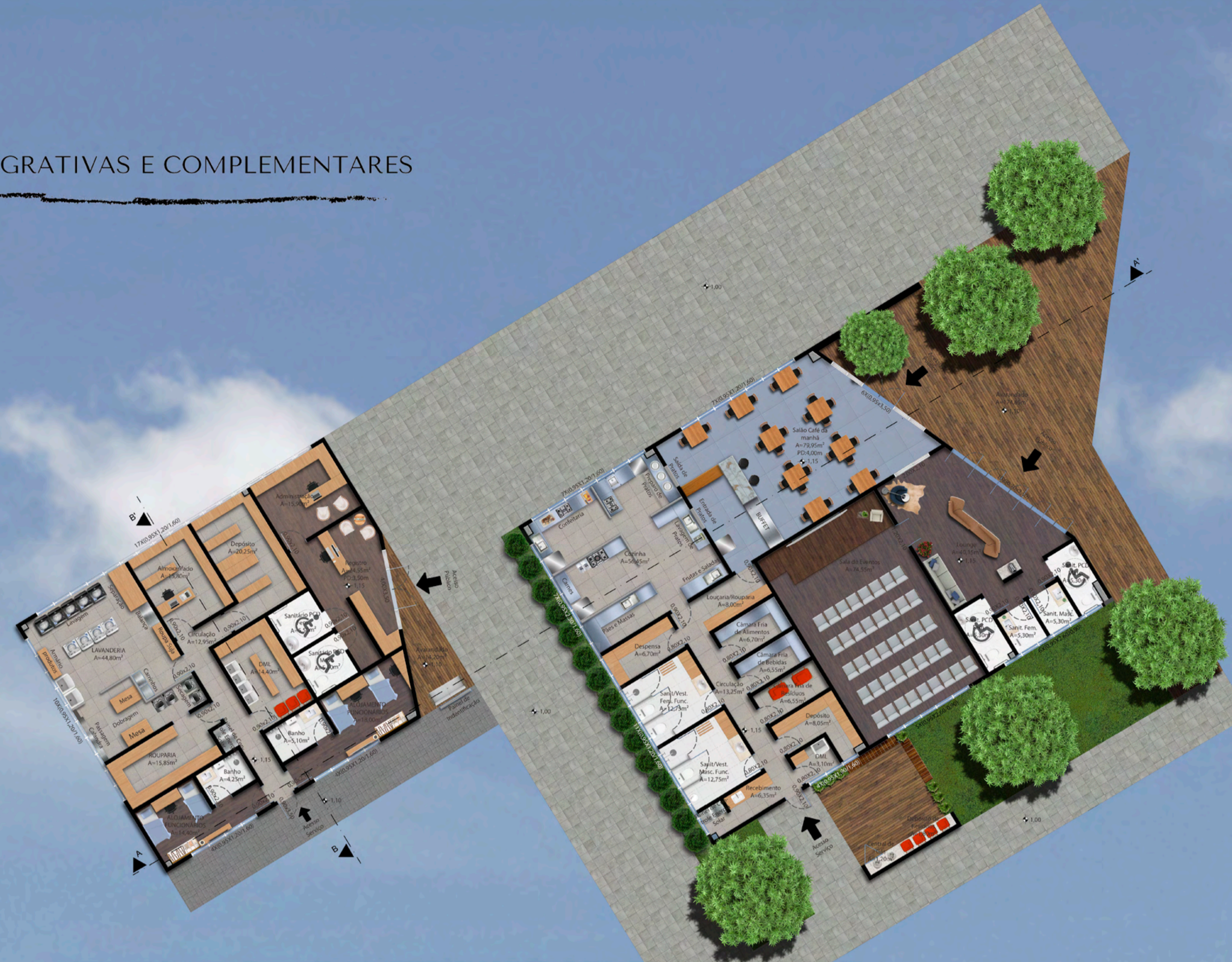
PLANTA BAIXA BLOCO DE CONVIVÊNCIA E SERVIÇO DO HOTEL