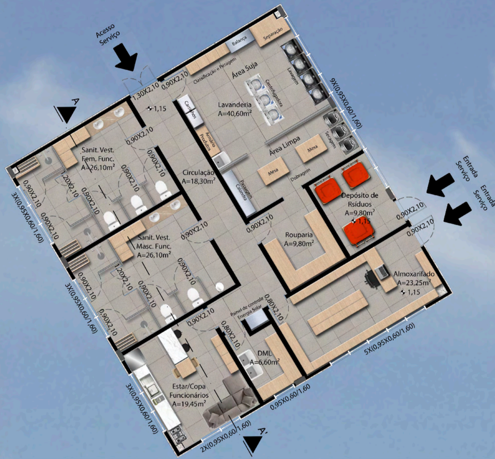
PLANTA BAIXA BLOCO DE APOIO E SERVIÇO