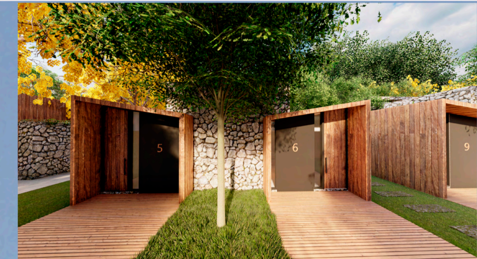
PERSPECTIVA FACHADA FRONTAL DO CHALÉ