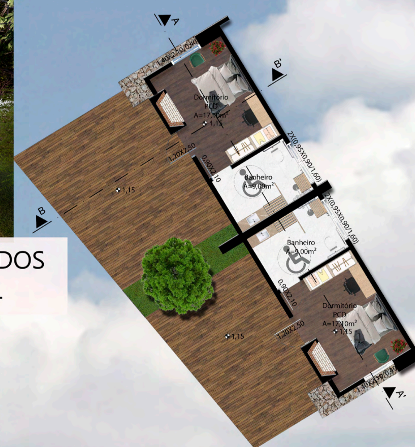
PLANTA BAIXA CHALÉ PCD