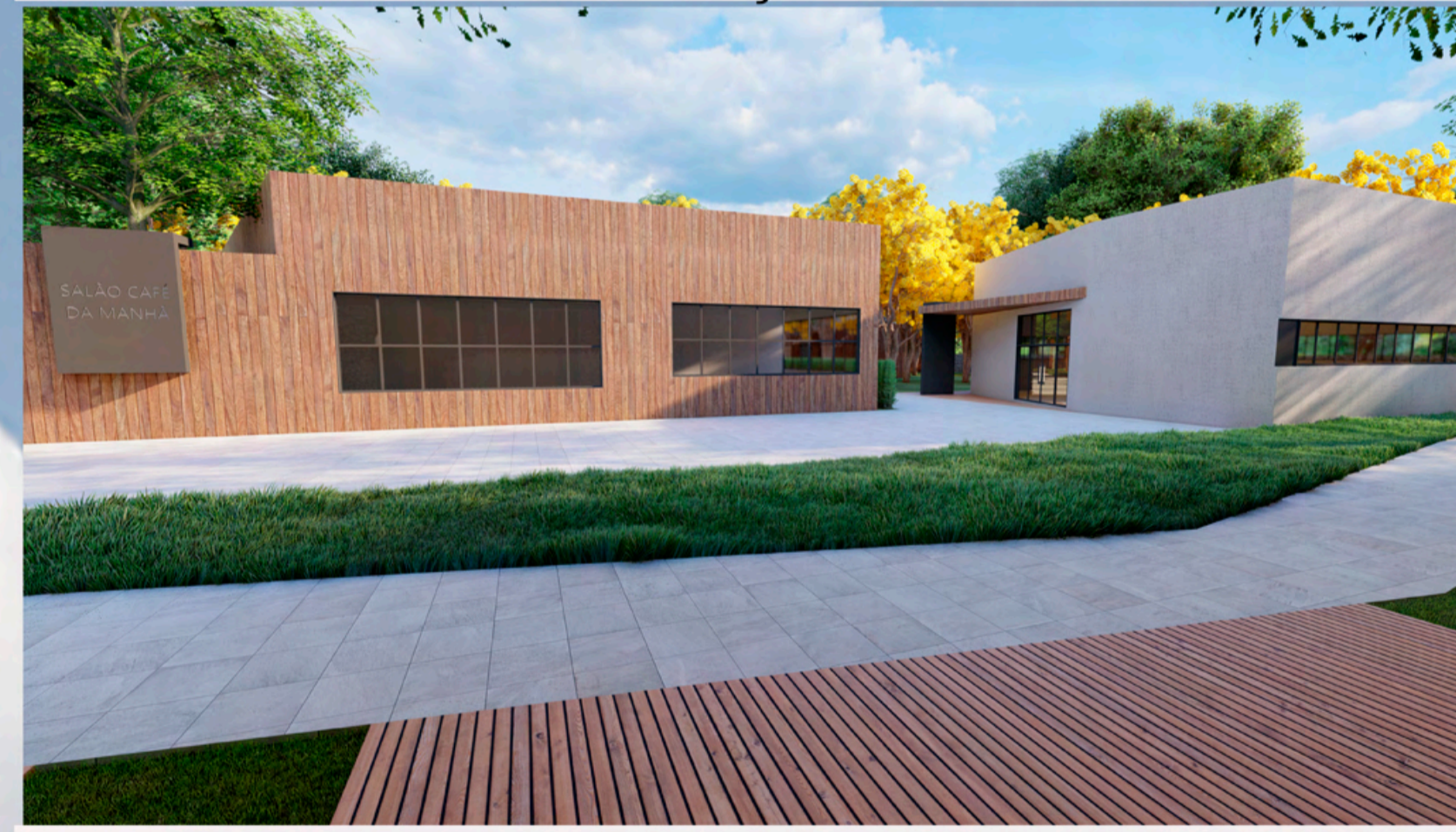
PERSPECTIVA BLOCOS DE CONVIVÊNCIA