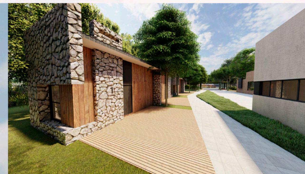
PERSPECTIVA CHALÉ PCD