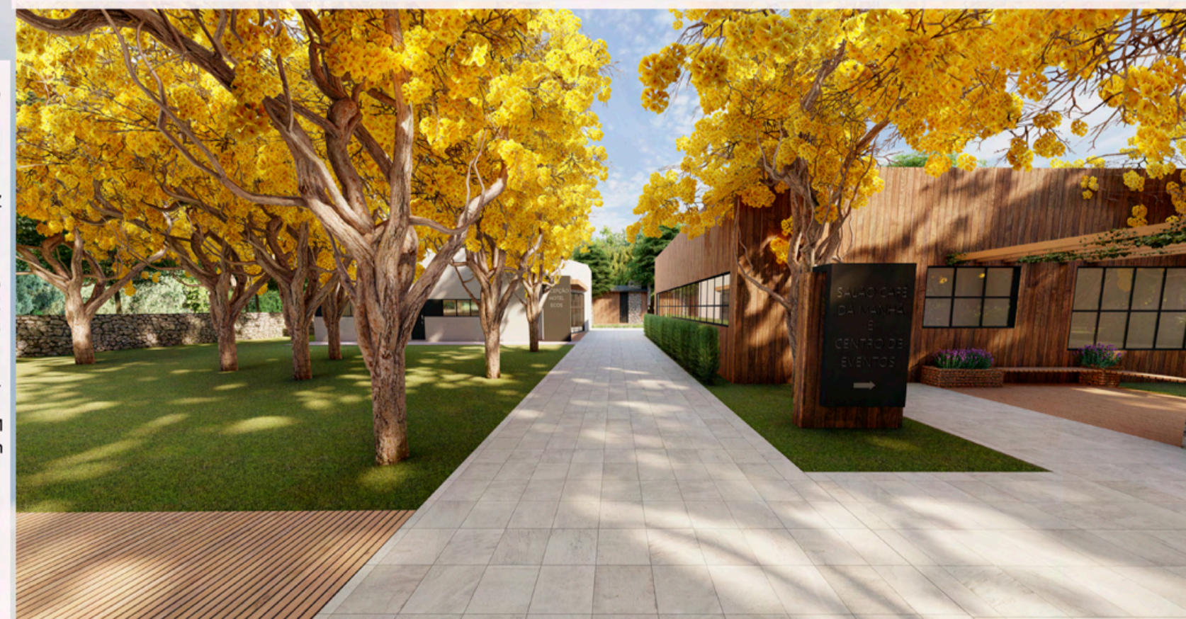
PERSPECTIVA BLOCOS DE CONVIVÊNCIA

PORTA JANELA EM PVC PRETO FOSCO COM VIDRO FIXO DE 12mm LAJE EM CONCRETO e=15cm CONTRAPISO e=2,5cm PISO FINAL EM PEDRA NATURAL - MÁRMORE SUEZ GREY - PASINATO (DIMENSÃO: 100cm x 100cm) SOLEIRA COM PINGADEIRA EM PEDRA BASALTO RIPAS EM MADEIRA ANGELIM DE REFLORESTAMENTO INSTALADAS NO SENTIDO TRANSVERSAL SOBRE BARROTES E FIXAÇÃO ATRAVÉS DE PARAFUSOS (DIMENSÃO: (L) 10cm x (C) 150cm x (E) 2,5cm) BARROTE DE MADEIRA NO SENTIDO LONGITUDINAL PARA FIXAR AS RIPAS DE MADEIRA BLOCOS EM CONCRETO PARA SUPORTE DE DECK EM MADEIRA ANGELIM REFLORESTADA (DIMENSÃO: 15cm x 15cm) PROTEÇÃO MECÂNICA e= 2cm IMPERMEABILIZAÇÃO MANTA LÍQUIDA FUNDAÇÃO EM CONCRETO ARMADO SOLO