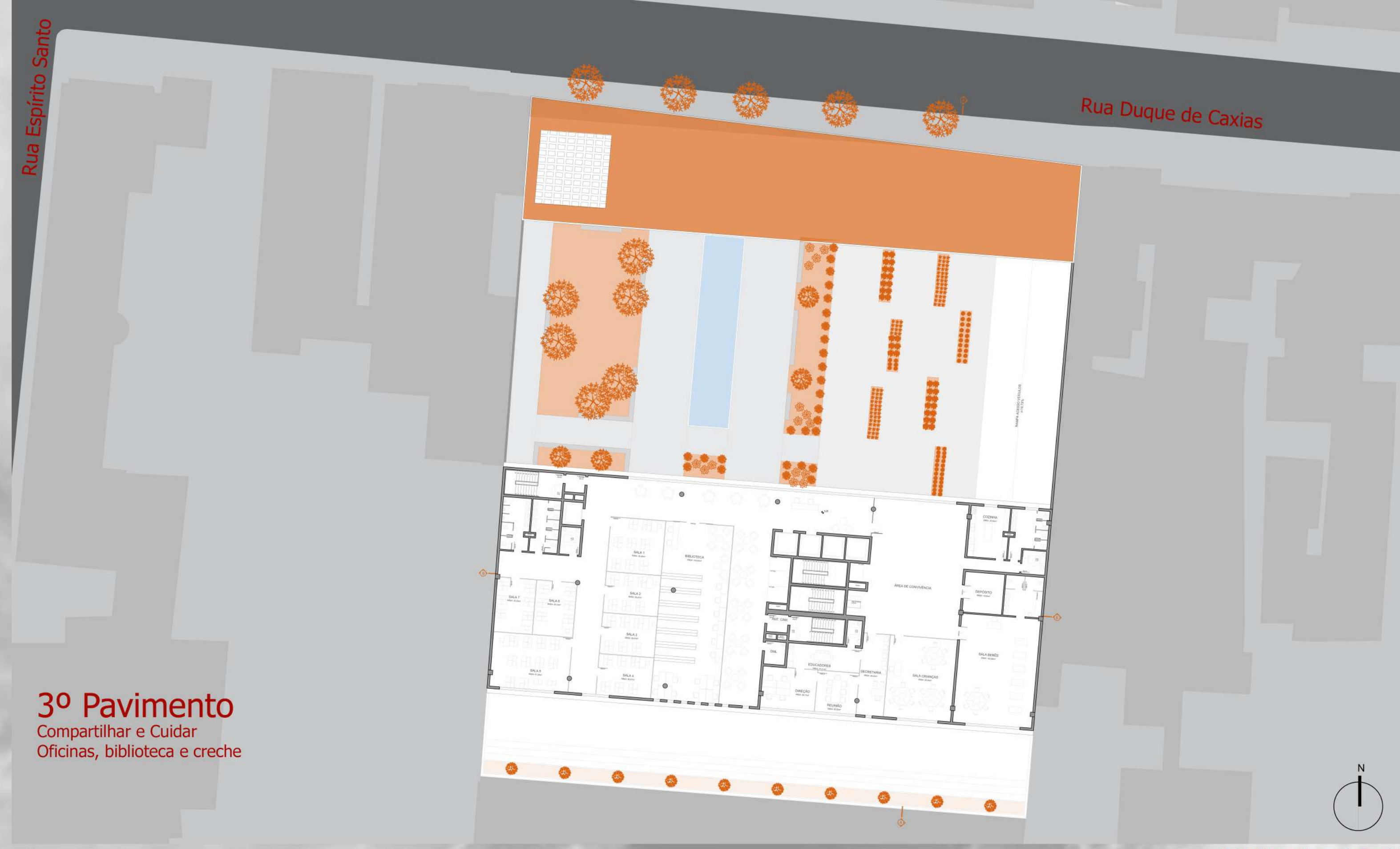
3º Pavimento Compartilhar e Cuidar Oficinas, biblioteca e creche