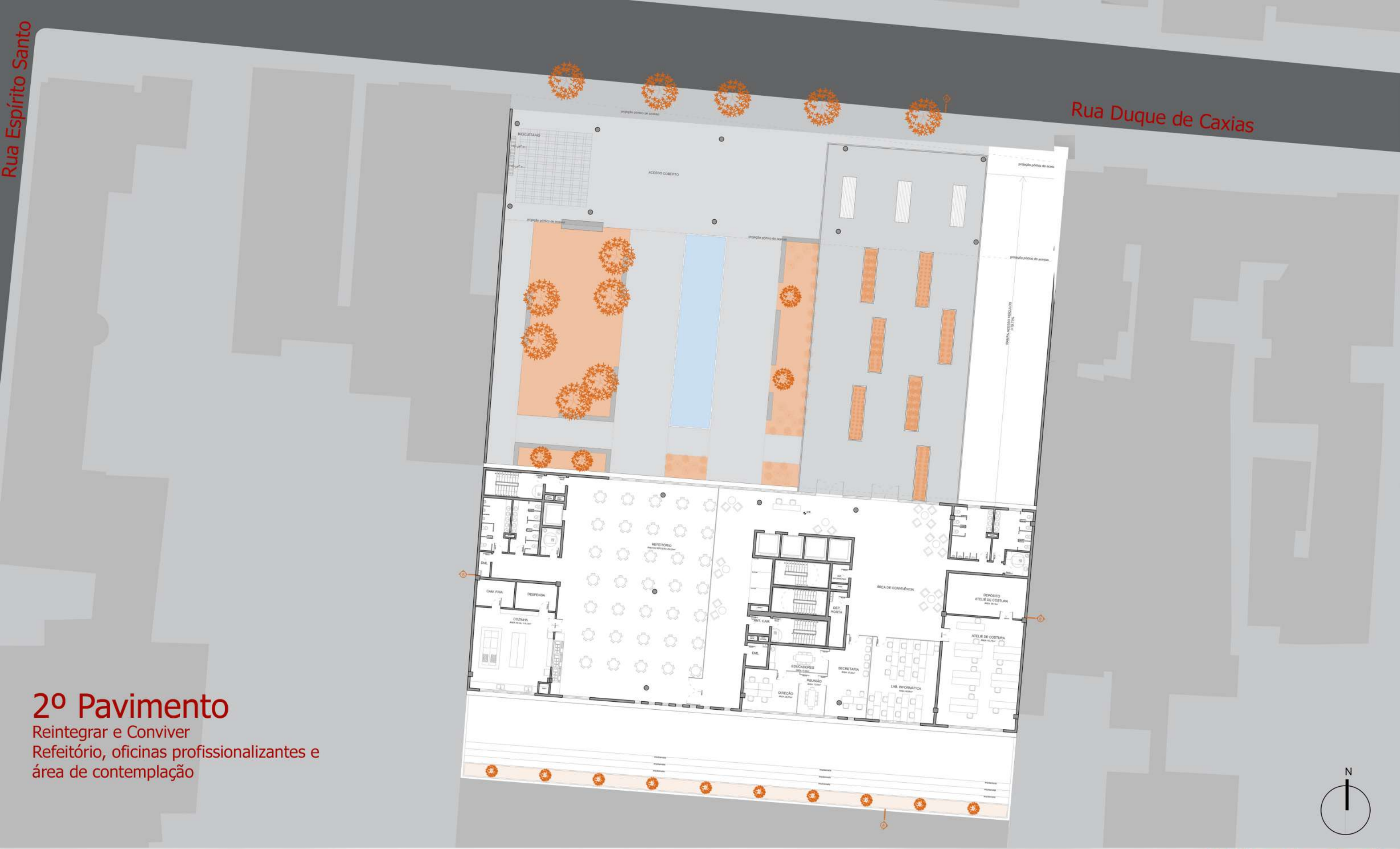
2º Pavimento Reintegrar e Conviver Refeitório, oficinas profissionalizantes e área de contemplação