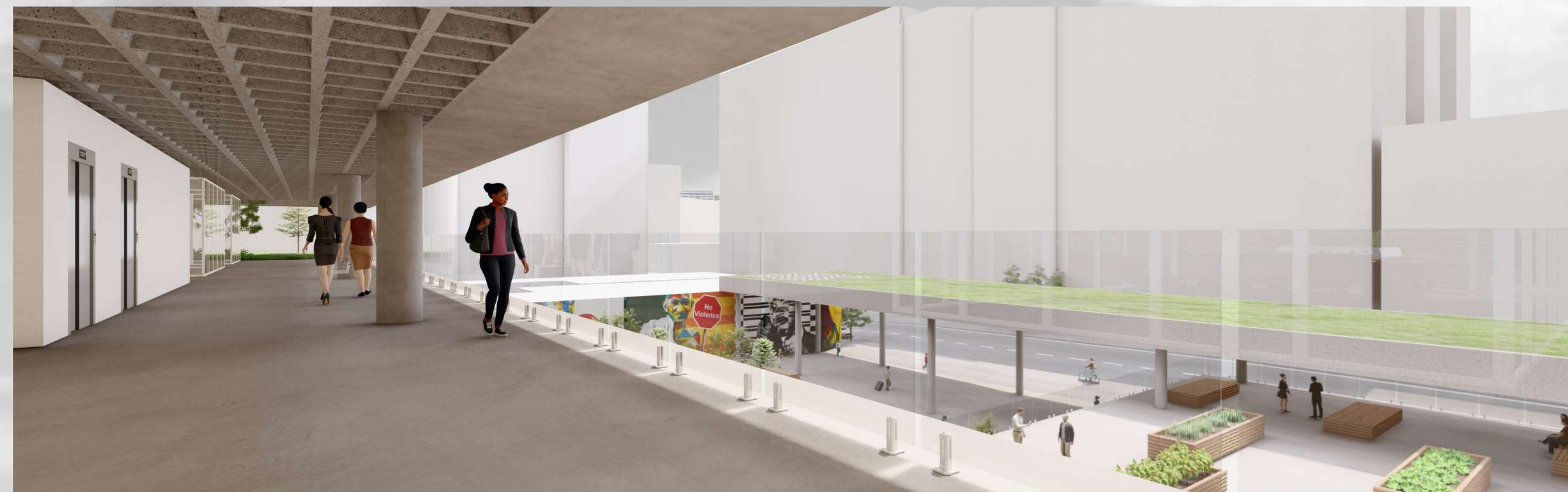
Área de convivência