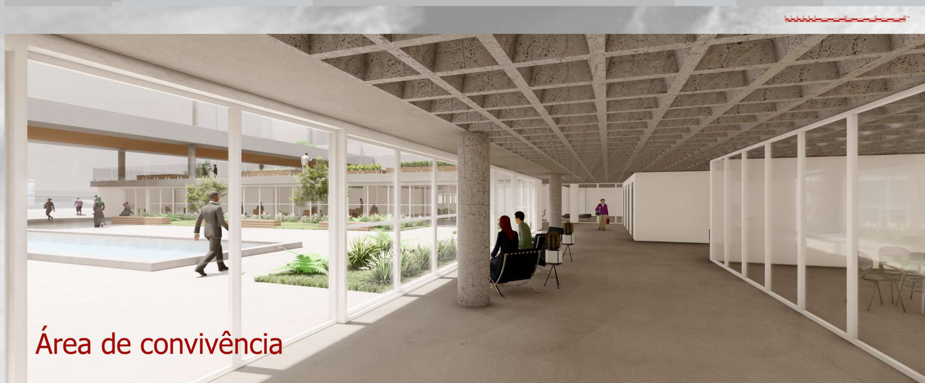
Área de convivência