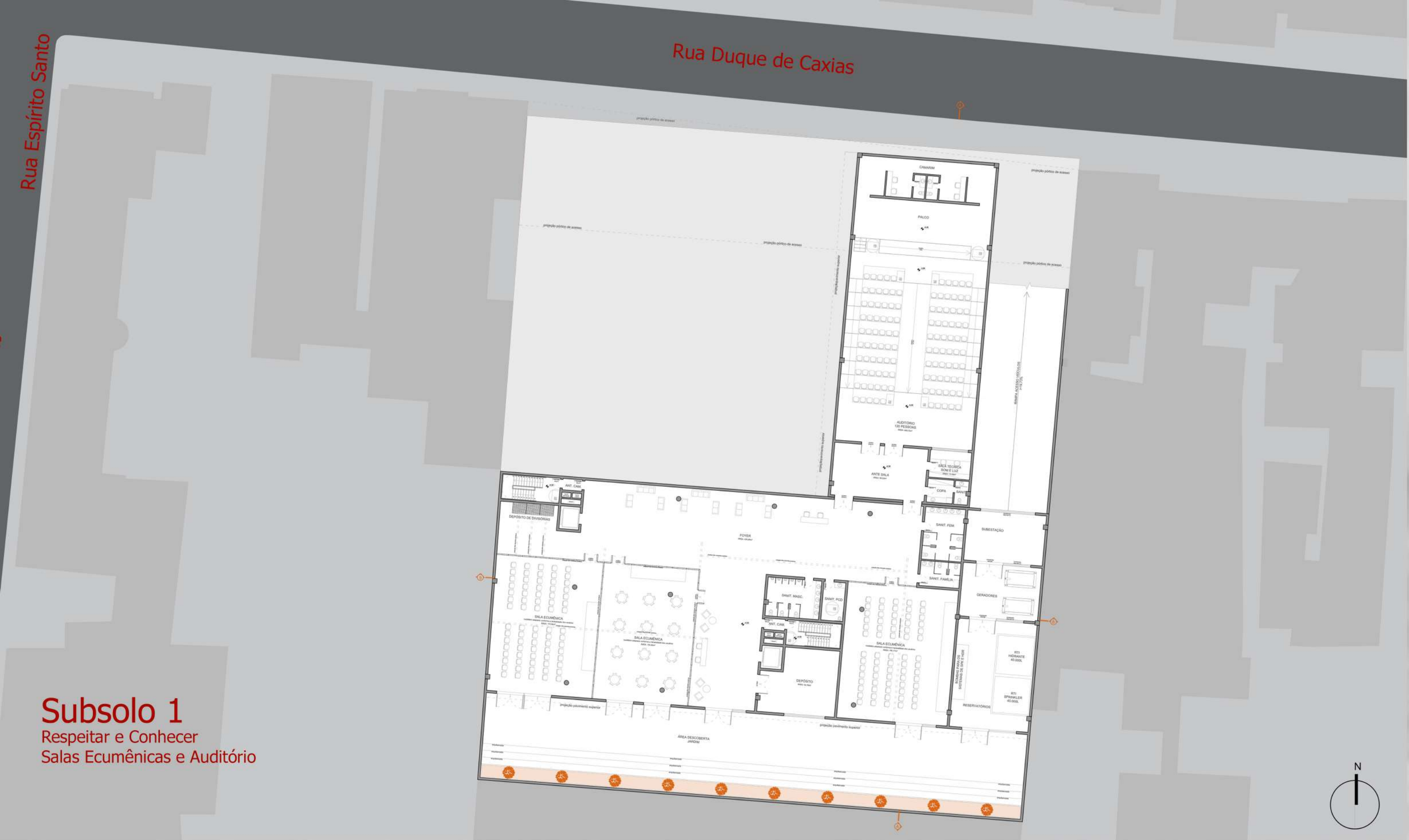
Subsolo 1 Respeitar e Conhecer Salas Ecumênicas e Auditório