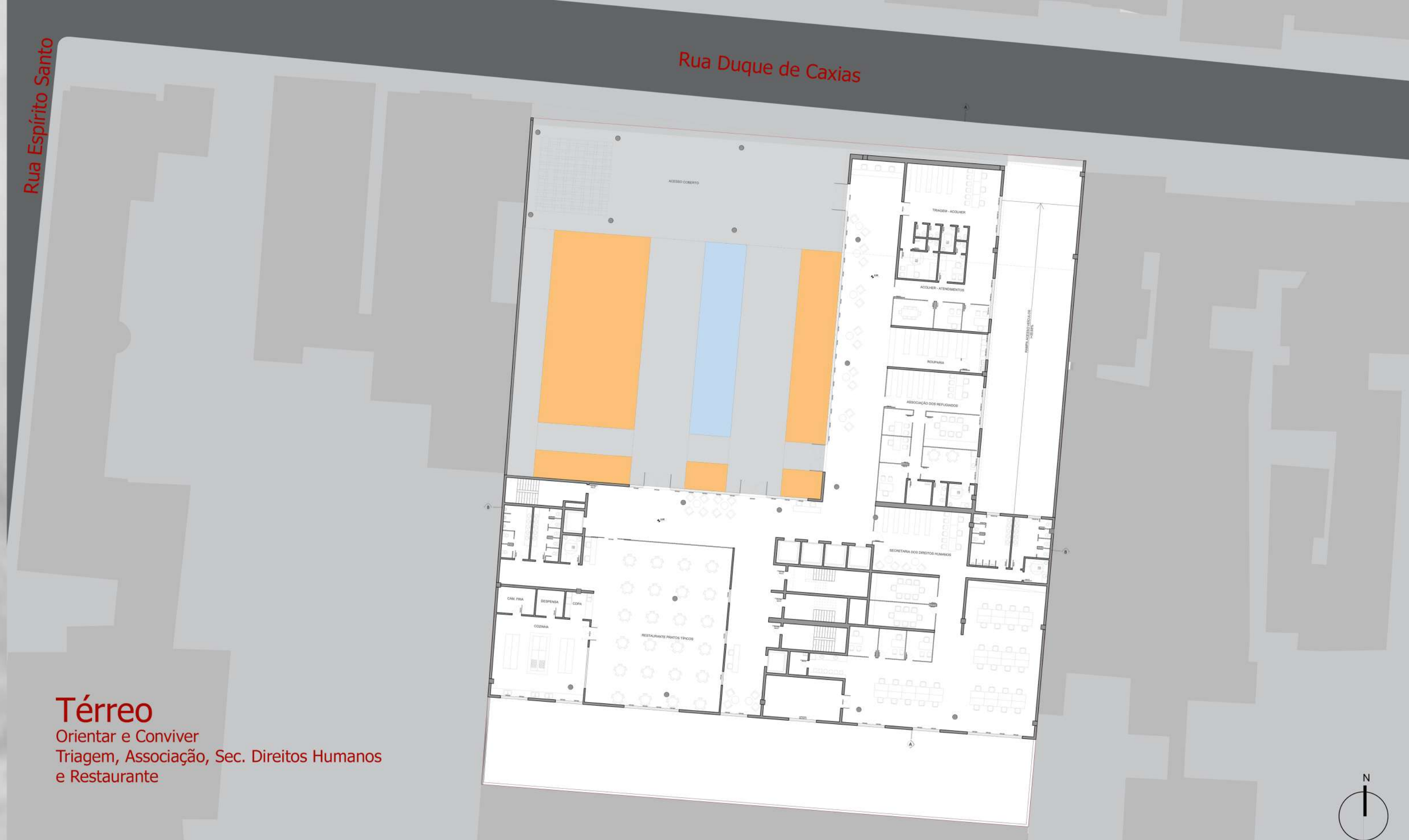
Térreo Orientar e Conviver Triagem, Associação, Sec. Direitos Humanos e Restaurante