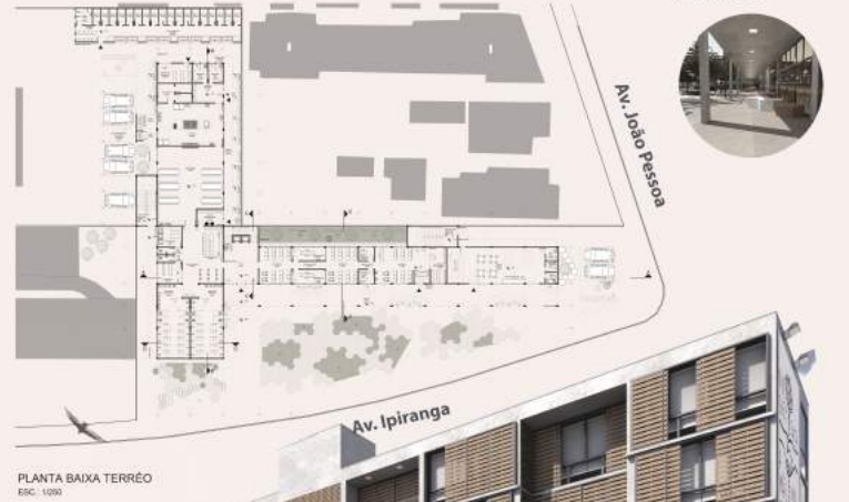
Estrutura convencional, composta por pilar, viga e laje de concreto moldada in loco.