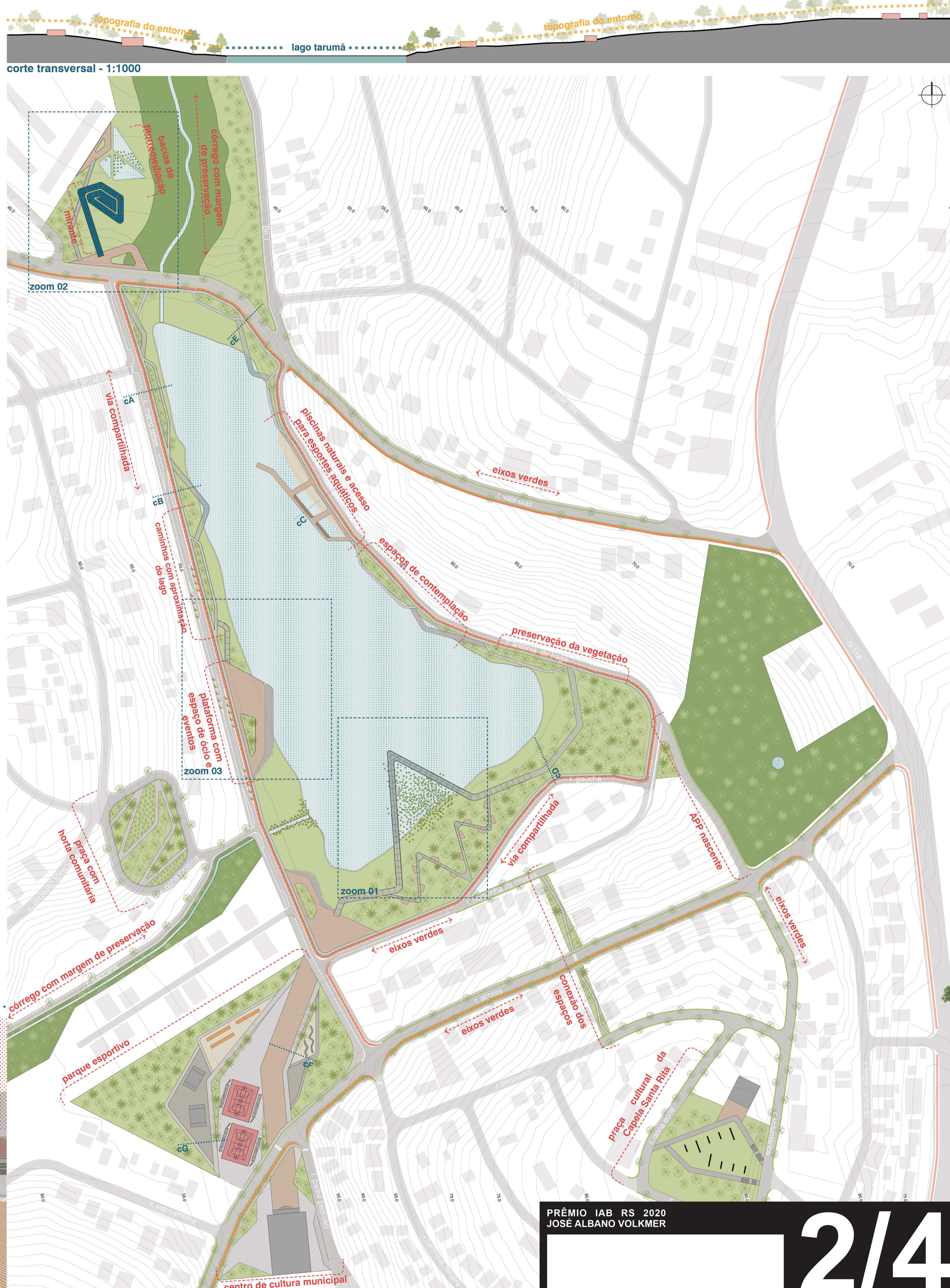
corte transversal - 1:1000