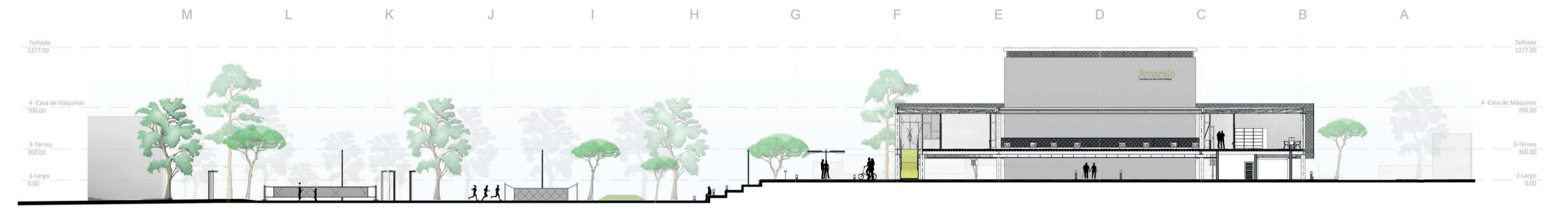
Corte BB 1/500