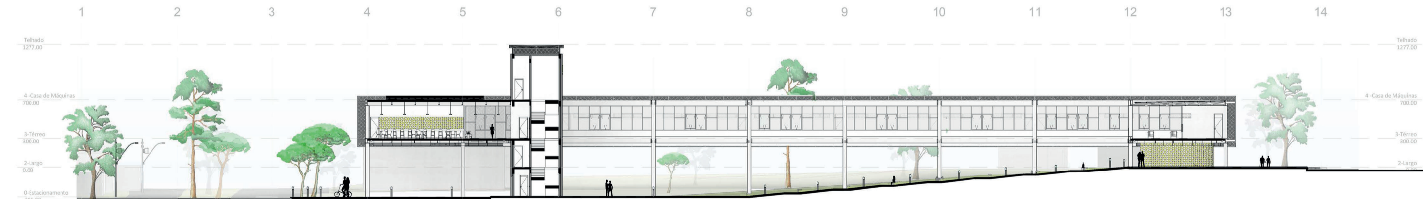
Corte AA 1/500