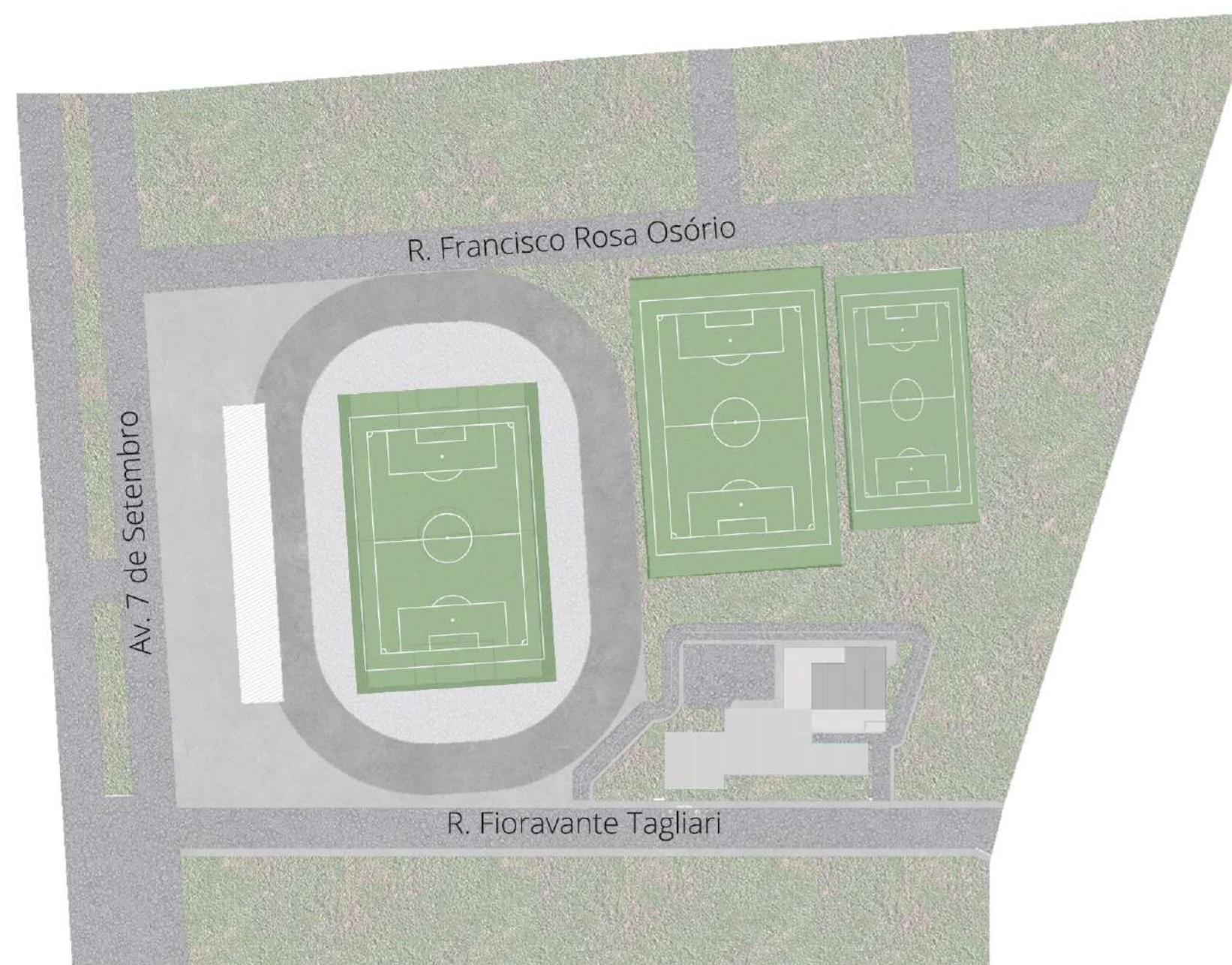
Planta de Situação Escala: 1:2000

O projeto foi pensado a partir do conceito de linhas, presente no mais importante palco do esporte, o campo de futebol. Nas artes visuais, a linha tem, por sua própria natureza, uma enorme energia. Nunca é estática, é o elemento visual inquieto e inquiridor do esboço. Ajudam a direcionar o olhar, criam ênfase e proporcionam sensação de movimento. Portanto, a estética visual do edifício foi baseada inteiramente na relação, dinâmica e unidade das linhas, presentes tanto na forma do projeto quanto em detalhes como as esquadrias que contrapostas a horizontalidade do projeto, são em sua maioria verticais dando contraste às fachadas e gerando sensação de grandeza, robustez e esbeltez. Além disso, este elemento cria um grande vão de iluminação porém ainda preservando a privacidade interior do edifício que antes de ser uma obra que o convida a entrar seja pelo seu apelo estético, seja pela ligação com o clube, é ainda um ambiente de trabalho.