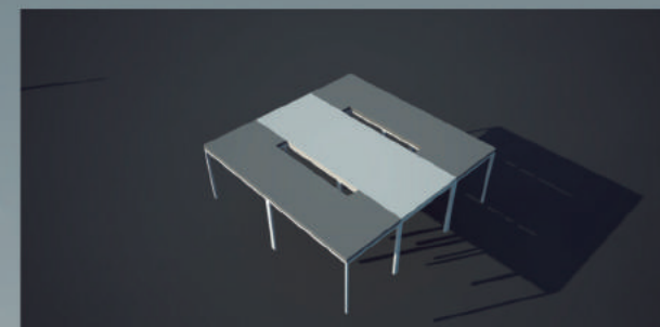
MESA FECHADA - USO COLETIVO

Materialidade: estrutura de alumínio, e tápos de madeira e revestimento de laca branca e cinza.