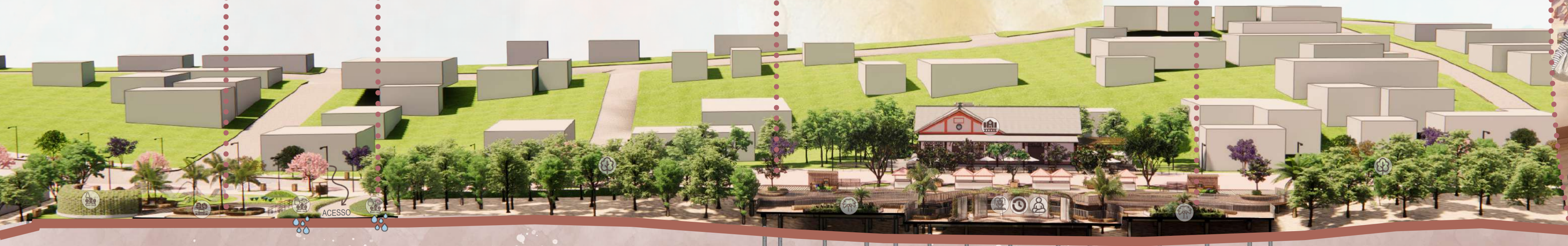
Perspectiva externa - círculo de memórias