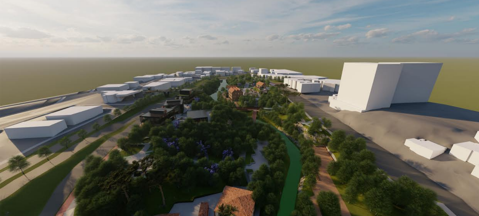
Vista aérea Sul a partir do centro