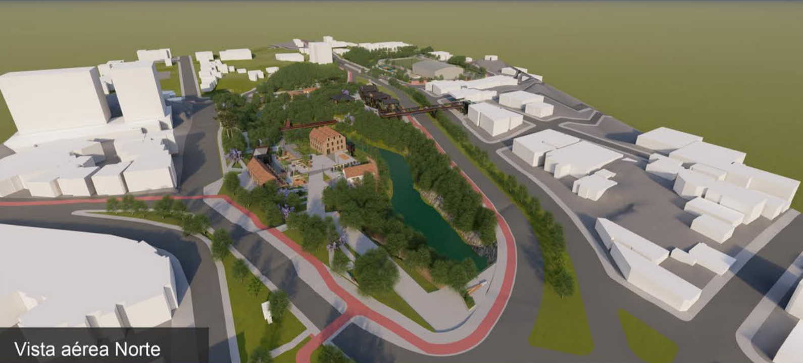
Vista aérea Norte