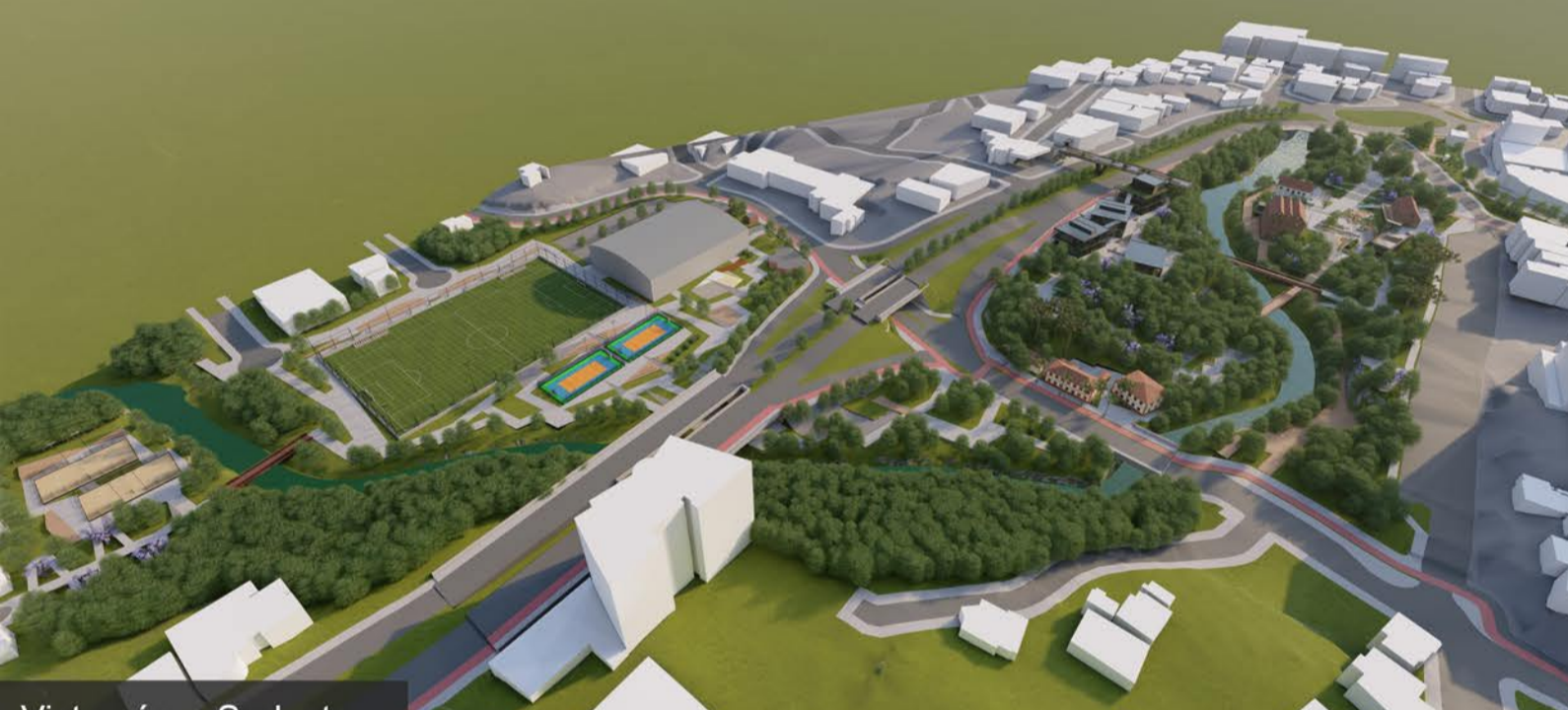
Vista aérea Sudeste