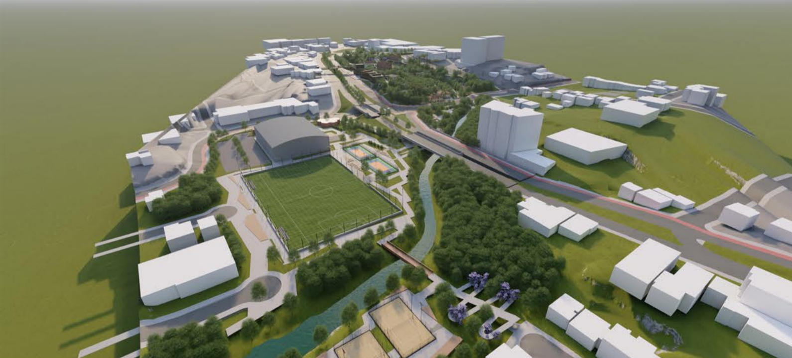
Vista aérea Sudoeste