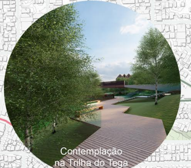
Contemplação na Trilha do Tega