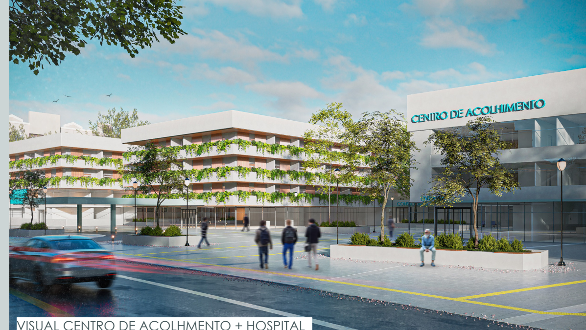
VISUAL CENTRO DE ACOLHIMENTO + HOSPITAL