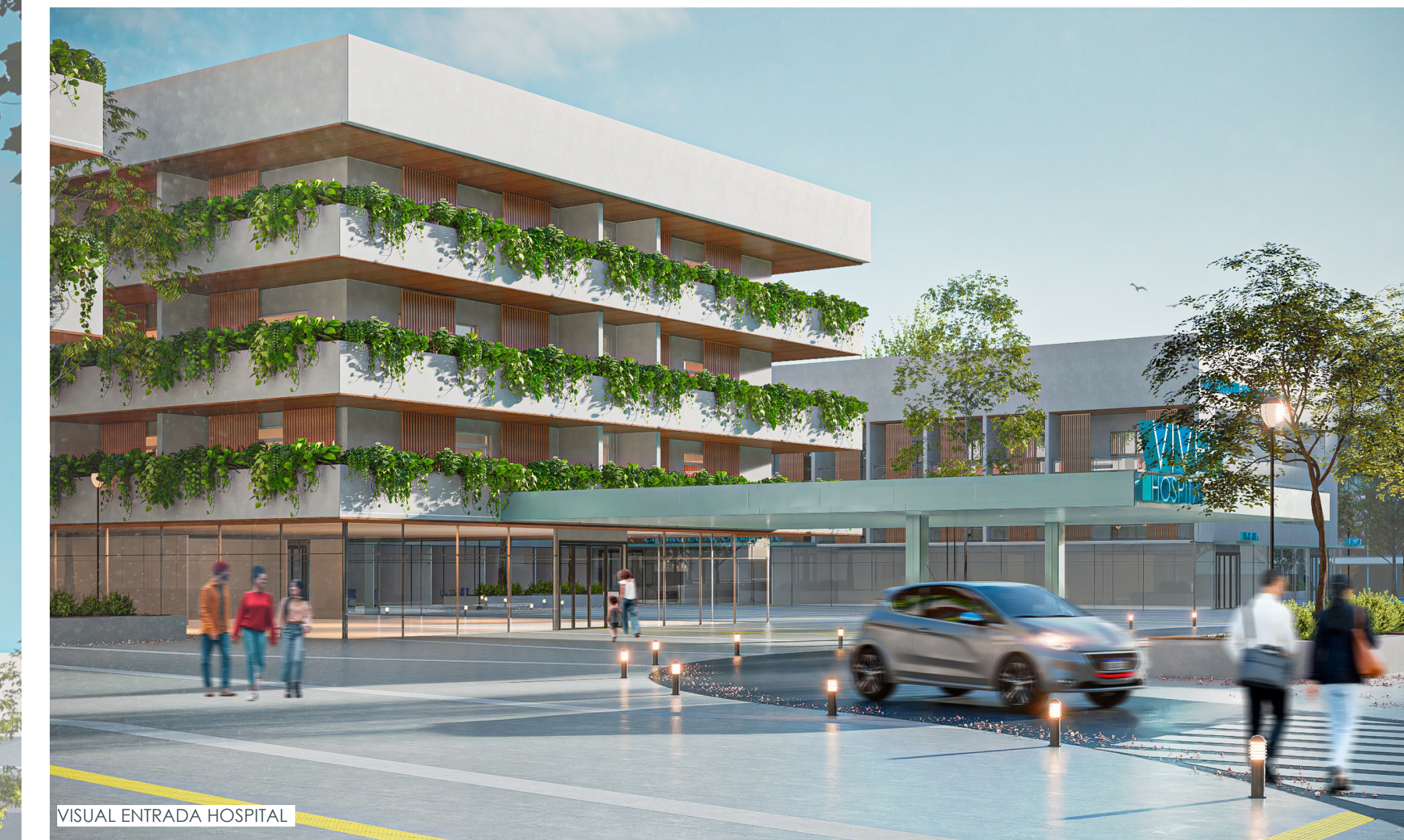
VISUAL ENTRADA HOSPITAL