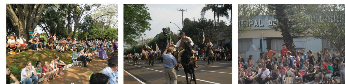
Imagem: Público na praça assistindo ao desfile da Semana Farroupilha na Rua Liberato Salzano em frente à Prefeitura Municipal.

Por Cândido Godói ser uma cidade pequena, a relação entre as pessoas e o lugar é estreita e íntima, assim, a qualidade desses espaços influencia significativamente na vida dos indivíduos e na sua forma de ver e viver a cidade. Devido a sua significativa influência tanto para o município como para a população, a praça representa o ponto de convergência da vida na cidade.