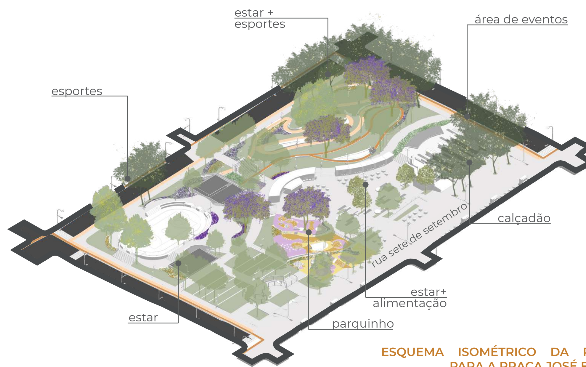
ESQUEMA ISOMÉTRICO DA PROPOSTA PARA A PRAÇA JOSÉ BONIFÁCIO

A praça atualmente já possui diversos usos, mas mal distribuídos e segmentados. Assim, o projeto foi pensado em áreas de concentração de atividades, como é apresentado no zoneamento abaixo, mas sempre buscando integrar um espaço com o outro, seja a partir do traçado, da vegetação ou piso, ou das conexões entre patamares. Além disso, uma das intenções principais foi traçar percursos objetivos mas que levassem os pedestres e usuários para o interior da praça. Também, a criação de espaços convidativos, arborizados e coloridos para que as pessoas permanecessem no espaço e deixasse de ser apenas um elemento de deslocamento da cidade.