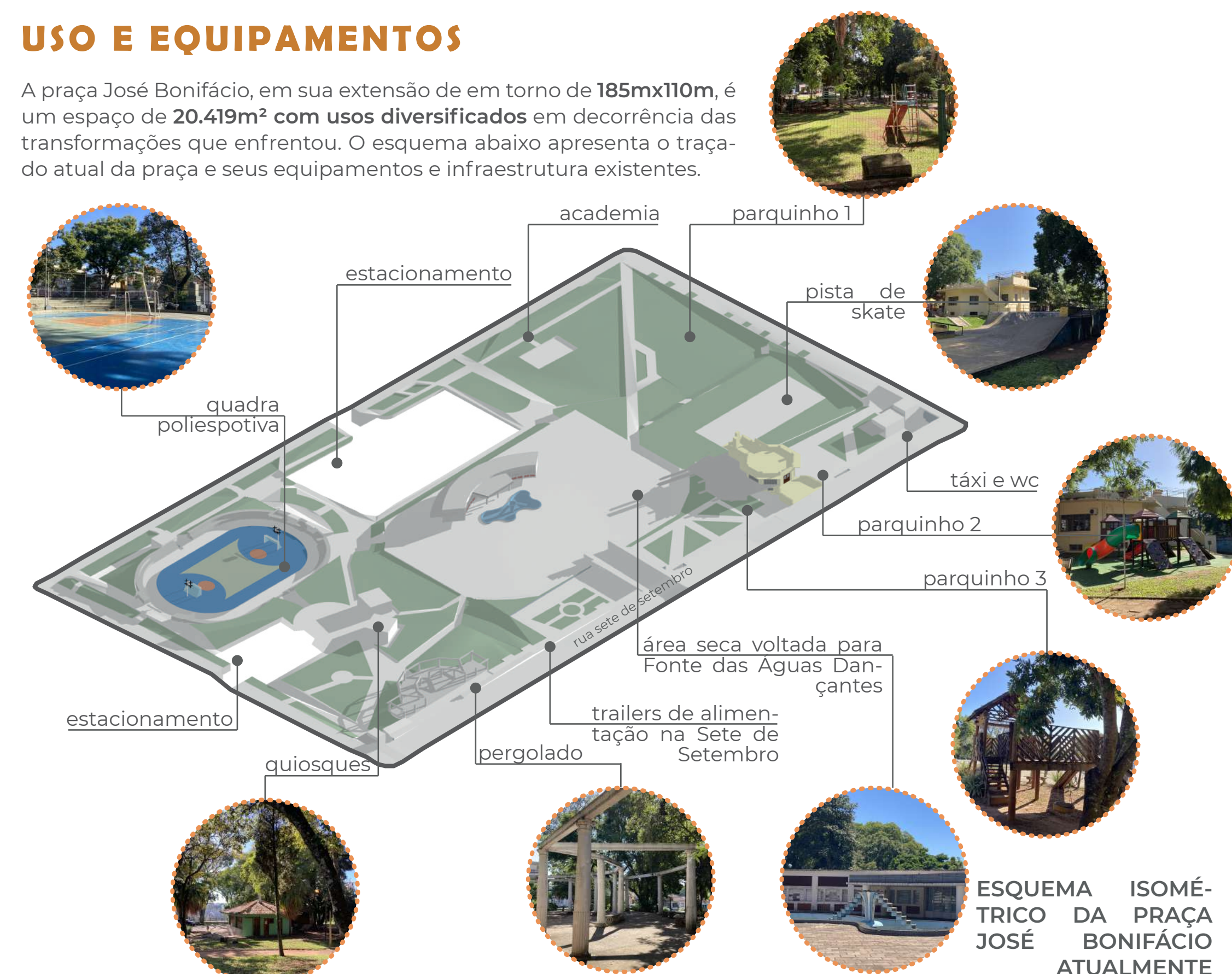
ESQUEMA ISOMÉTRICO DA PRAÇA JOSÉ BONIFÁCIO ATUALMENTE

A praça José Bonifácio, em sua extensão de em torno de 185mx110m, é um espaço de 20.419m 2 com usos diversificados em decorrência das transformações que enfrentou. O esquema abaixo apresenta o traçado atual da praça e seus equipamentos e infraestrutura existentes.