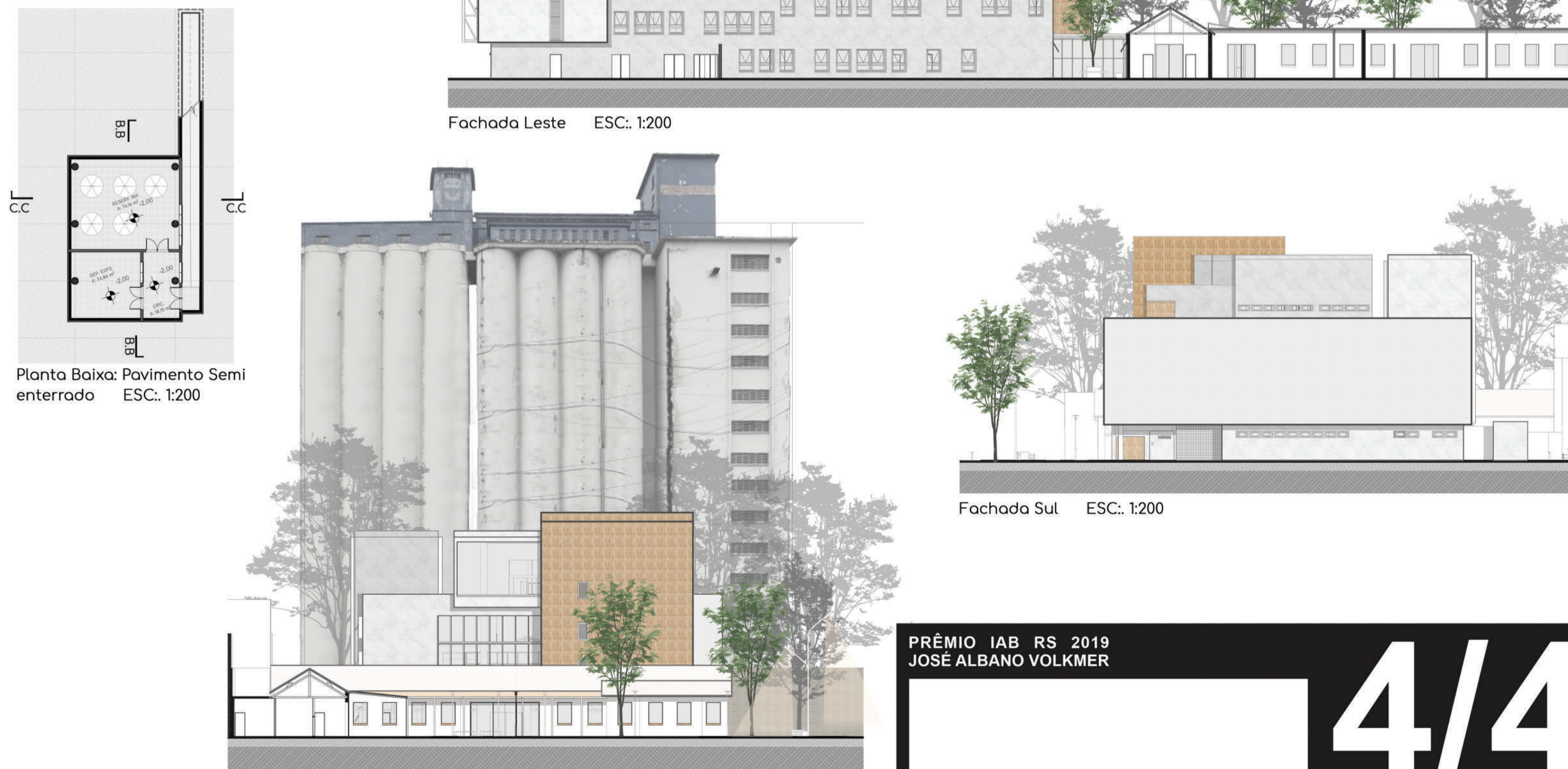
Fachada Leste ESC.: 1:200