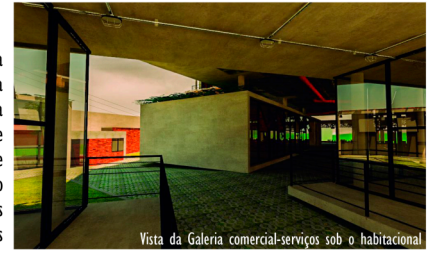
Vista da Galeria comercial-serviços sob o habitacional

O "Sistema Leupen", foi implantado na República do Pampa integrando os usos de comércio-serviço, sendo que estes alocados no pavimento térreo atendem as premissas de flexibilidade que estas "caixas" proporcionam.