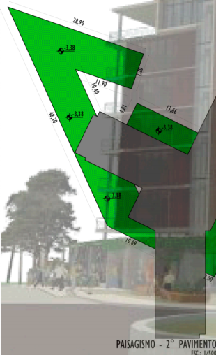
PAISAGISMO - 2º PAVIMENTO ESC. 1/500