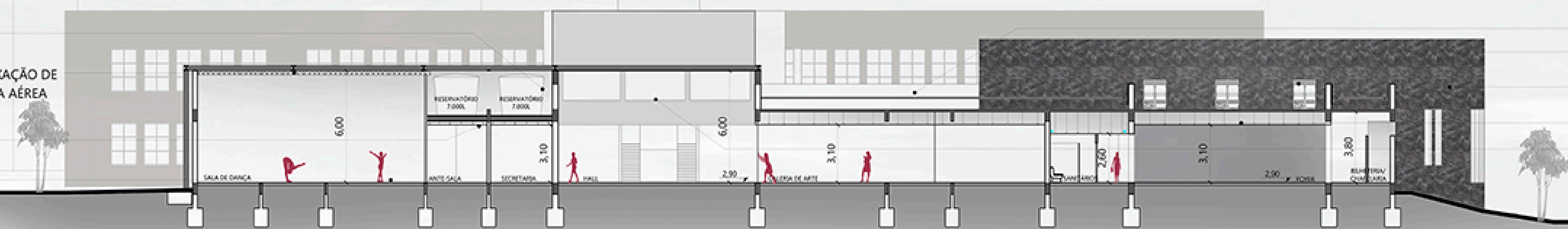
CORTE B'B'' ESC.: 1/200

VFR - UNIDADE EXTERNA DE AR CONDICIONADO ESTRUTURA METÁLICA PARA A FIXAÇÃO DE CENOGRAFIA E ENSAIO DE DANÇA AÉREA FORRO DE GESSO PISO TABLADO DE MADEIRA