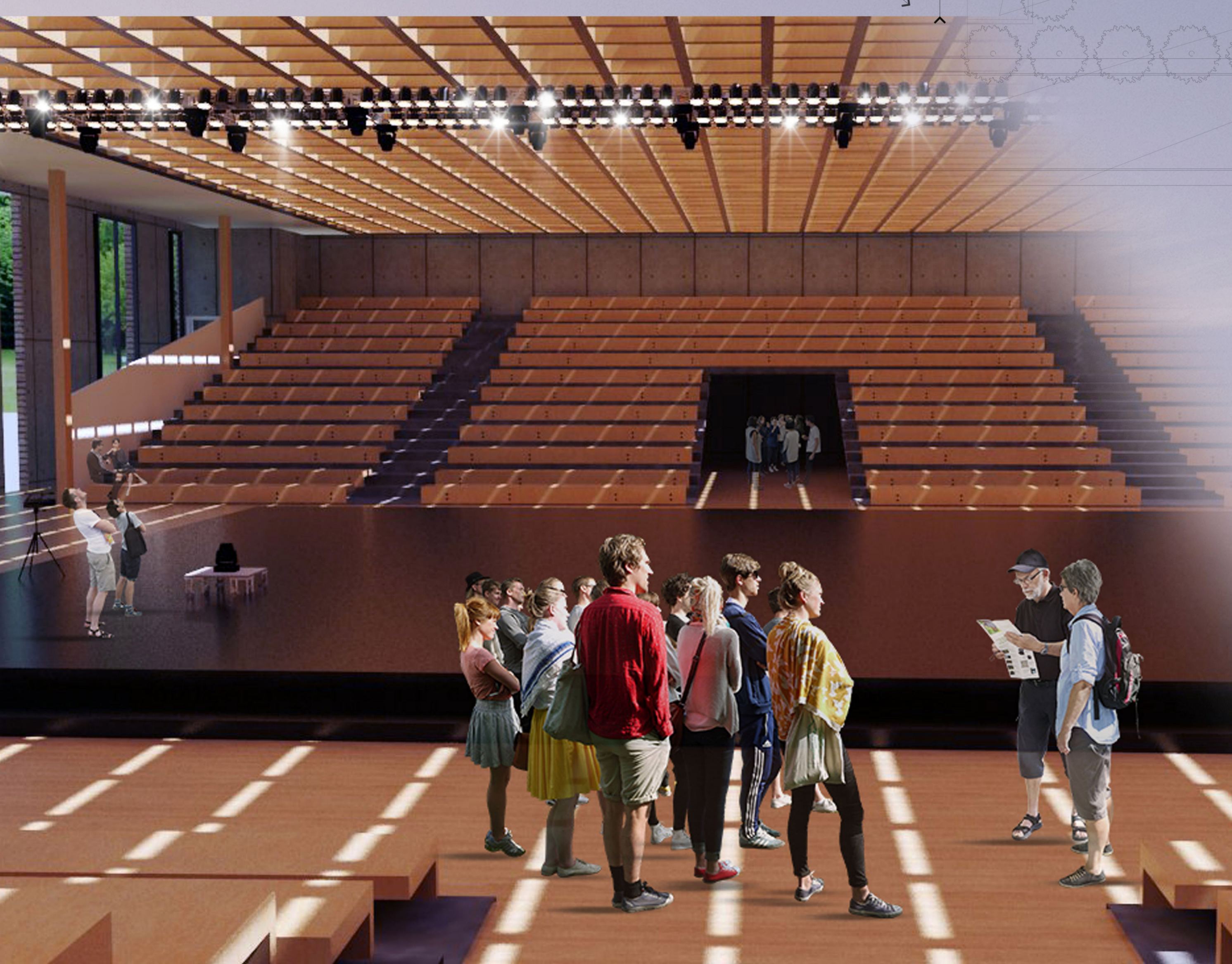
PLANTA BAIXA 1º PVTO. ESCALA 1/200